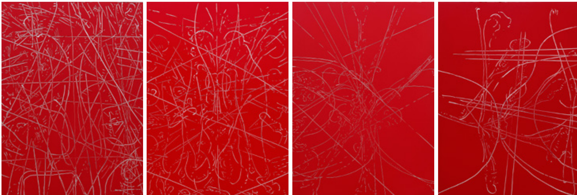
Carlito Carolhosa sem título/untitled 2015 -- óleo sobre alumínio/oil on aluminum -- 122 x 90cm cada/each