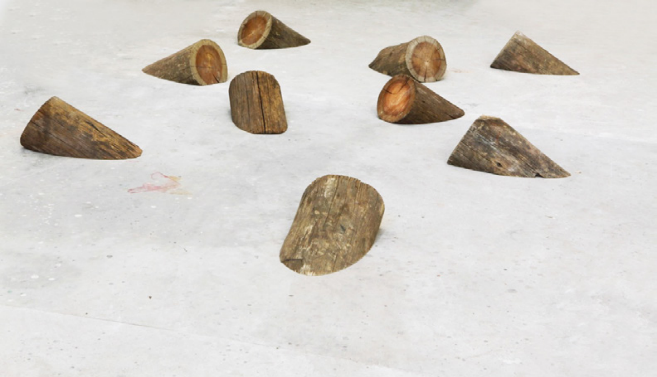
Carlito Carvalhosa Volta e meia 2015 -- madeira/wood -- instalação site specific/site specific installation -- dimensões variáveis/variable dimensions