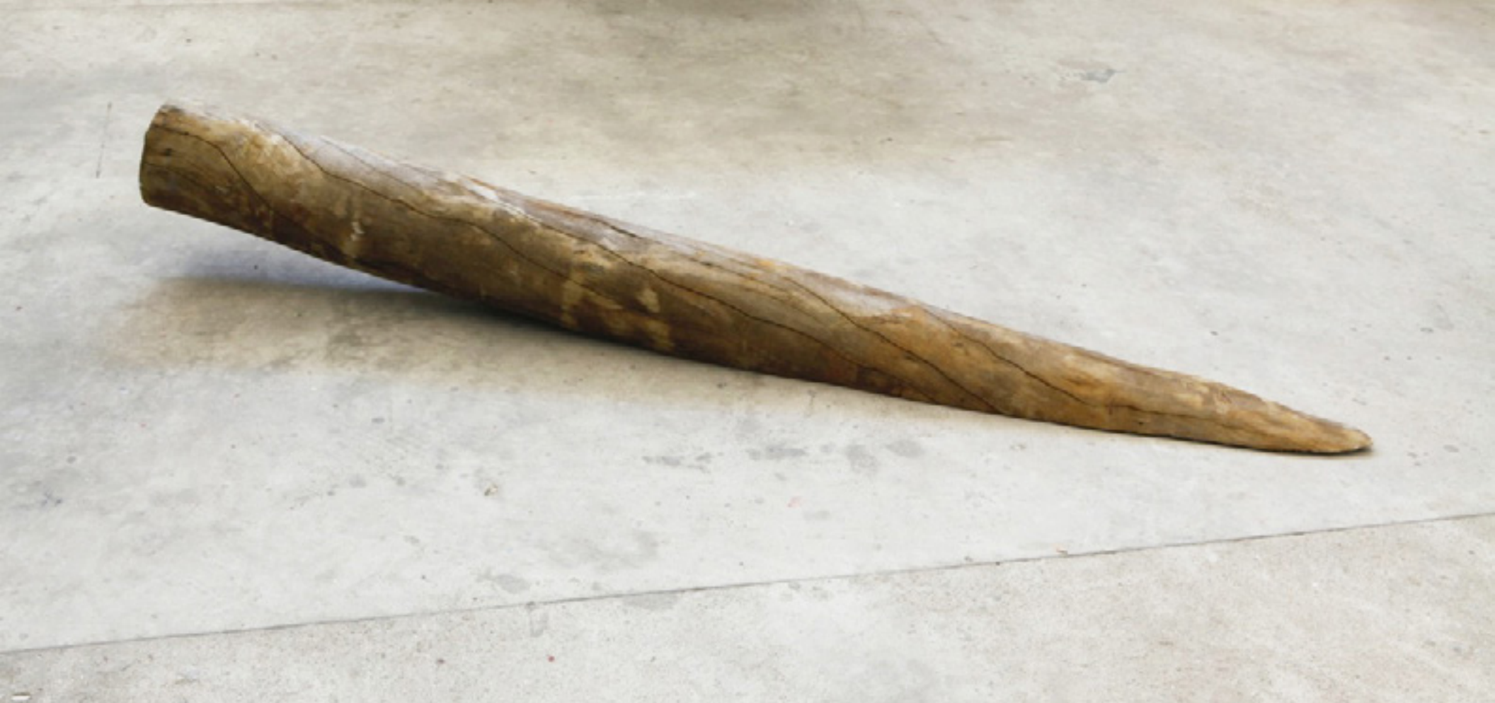
Carlito Carvalhosa Volta e meia 2015 -- madeira/wood -- instalação site specific/site specific installation -- dimensões variáveis/variable dimensions