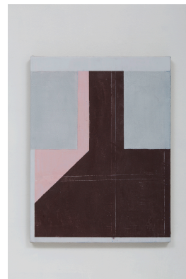
sem título , 2015 óleo e cera sobre linho 40 x 30 cm