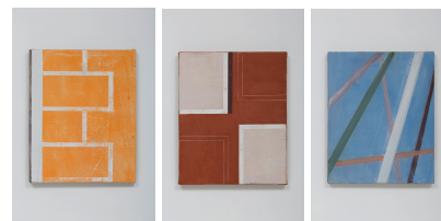
sem título , 2016 óleo e cera sobre linho 30 x 24 cm cada

Para obter mais informações, por favor entre em contato com a galeria: comunicacao@nararoesler.com.br