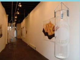
Installation view, Dust , at Magnan Projects, New York. Vista de la Instalación, Dust , en Magnan Projects, Nueva York.