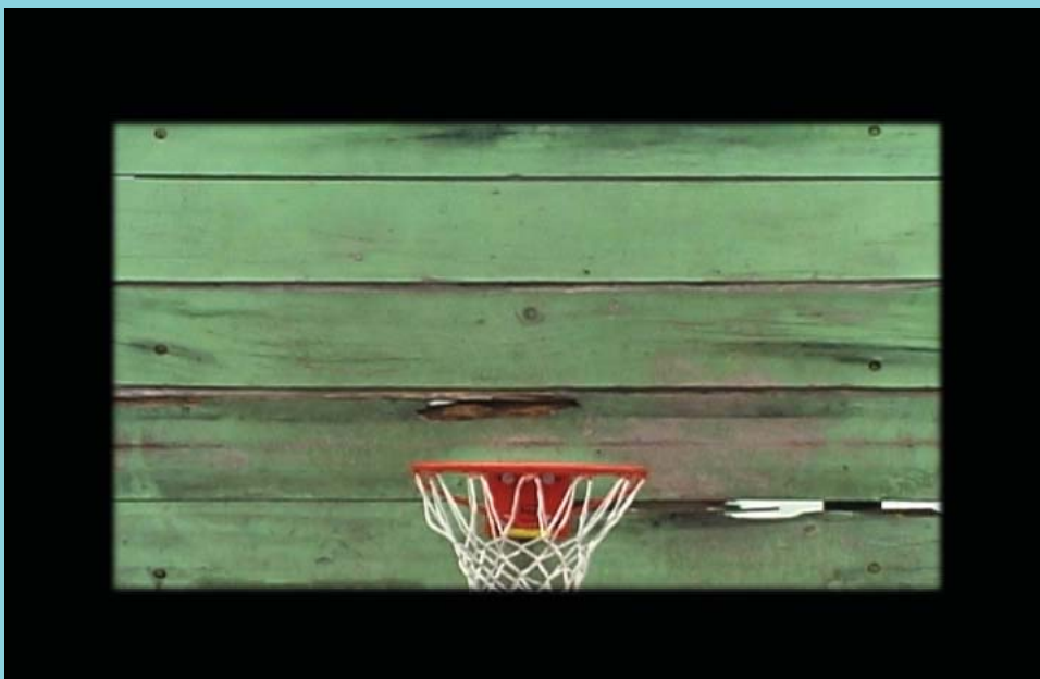
Sudor , 2005. Still from video installation. Sudor , 2005. De la instalacion de video.