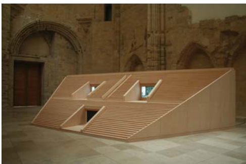
Perpetual free entrance. 11,00 x 2,50 x 4,50 m.

La pieza también subvierte la idea de quién ve y qué se supone que debe verse en un espacio institucional, como por ejemplo un museo o una galería. En El Jardín de la desconfianza , no es sólo el espectador el que contempla la obra de arte, sino que la instalación también penetra en el espacio del espectador, violando su privacidad. En otra instalación individual, Sudor (2004), se proyectan imágenes de un juego de baloncesto en una cancha de ese deporte en La Habana. Para este proyecto, Arrechea filmó a sus vecinos jugando al baloncesto en el mismo espacio público a lo largo de una semana. La cámara se mantuvo siempre enfocada sobre las pizarras de la cancha, de manera