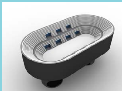
Entrada Libre Para Siempre , installation inside the Patio Herreriano at the Museo de Arte Contemporaneo in Valladolid, Spain 2006. Entrada Libre Para Siempre , instalacion dentro del Patio Herreriano en el Museo de Arte Contemporaneo de Valladolid, España 2006.