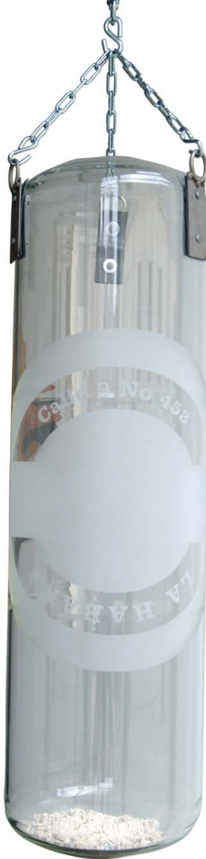
Alexandre Arrechea, from the series Dust , 40 x 14 in, 2005, hand-blown glass punching bag and debris from Cuba. Alexandre Arrechea, de la serie Dust , 35.5 x 35.5 cm, bolsa de boxeo en cristal soplado y escombros de Cuba.