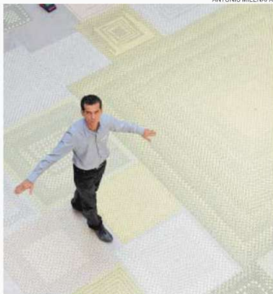
TAPETE – O artista na obra que fez para o octógono da Pinacoteca

Sem dúvida, como diz o artista, sua produção se relaciona com a herança construtiva brasileira. Seja numa instalação ou numa pintura (na quinta-feira ele inaugura na Galeria Nara Roesler uma mostra com 10 obras recentes dessa vertente), suas estruturas padronadas, que vêm da matemática e do jogo de combinações, se transformam em campos de geometria e remetem ao optical: ele sempre começa um módulo do centro de sua área e daí vai construindo a composição em movimento espiral. No caso das pinturas, a construção não é apenas formal, mas há ainda a interferência do artista de pintar as peças com esmalte sintético e assim criar um campo pictórico dentro do módulo (faz, dessa maneira, até dégradés de cores). “As pinturas também são ocupações de espaço”, diz o artista. Dessa maneira, seu trabalho se transforma, também, em jogo entre macros e micros. ●