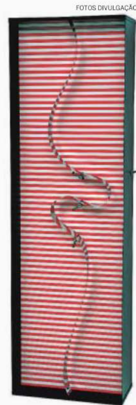
LE PARC – Forme en Contorsion