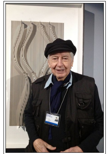
Julio Le Parc.

JULIO LE PARC , du 27 février au 13 mai, Palais de Tokyo, 13, avenue du Président Wilson, 75116 Paris, tél. 01 81 97 35 88, www.palaisdetokyo.com