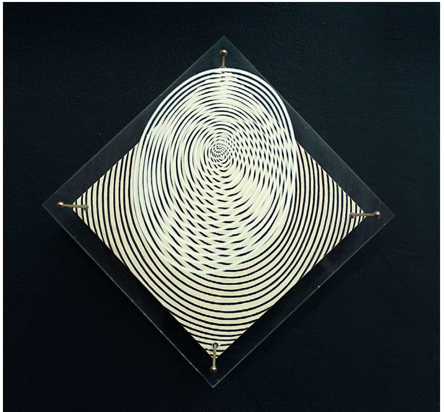
Jesús-Rafael Soto, spirale, 1955, peinture sur bois et sur plexiglas, métal, 30 x 30 x 28 cm, dation, 2011.

COMMENT SE PLACE SOTO DANS CETTE CONSTELLATION ? Il arrive à Paris avec l'idée de poursuivre les recherches entamées par Mondrian et Malevitch, donc avec un esprit très pictural. Mais partant de là, il découvre le groupe Madí, Agam, Pol Bury, Tinguely et, en 1959, le groupe Zero. Il comprend alors, après Calder, qu'on peut faire bouger Mondrian, et son œuvre prend un tour vibratile. Déjà, un tableau de 1952 suggérait une œuvre ouverte, un tableau animé par des carrés, puis des traits et enfin des points. Une Spirale de 1955 témoigne de l'influence conjuguée de Vasarely - avec son usage du calque - et de Duchamp avec le rotorelief.