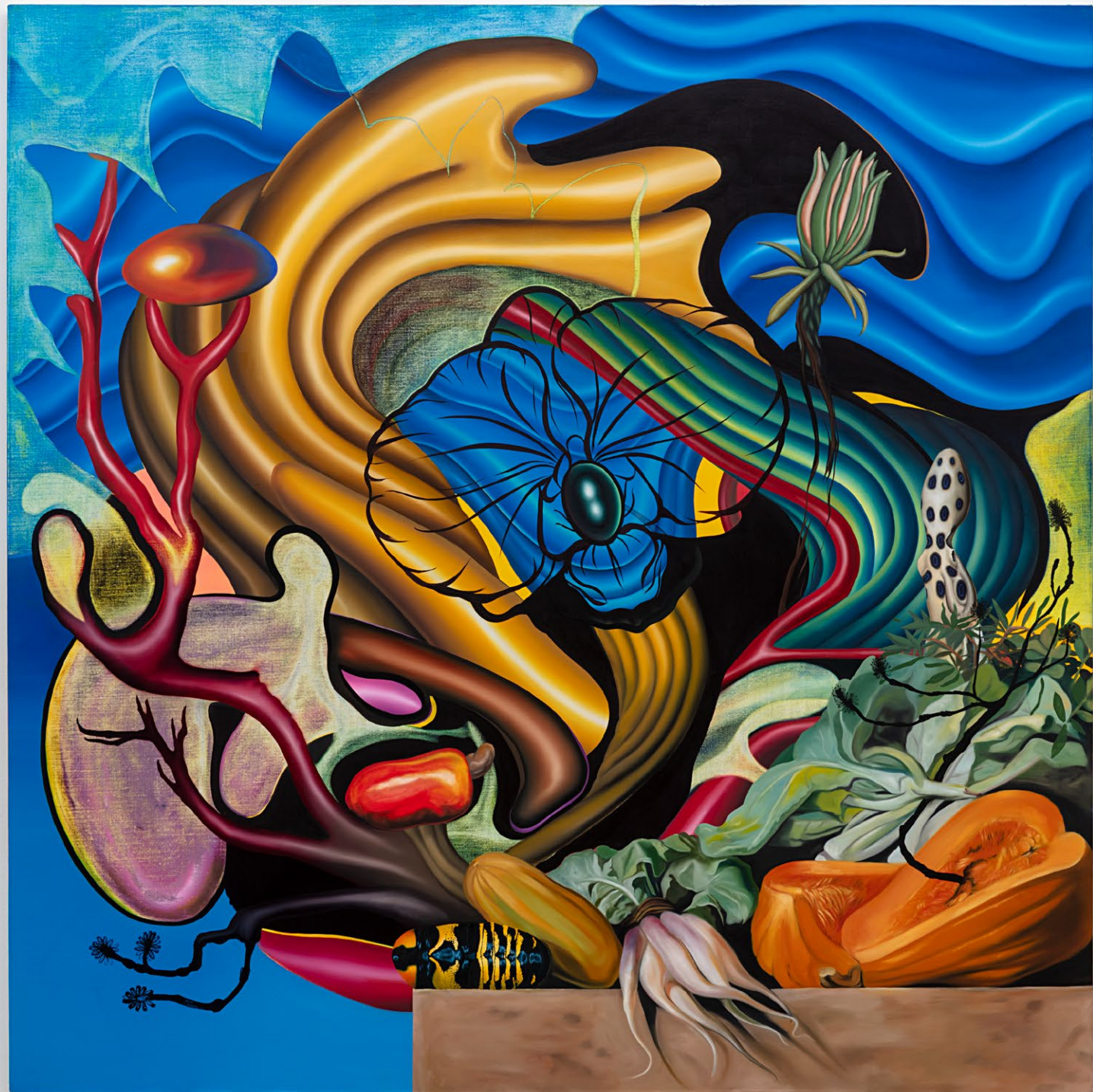
Tropical Eckhout volumen, 2026 tinta óleo sobre linho 200 x 200 cm