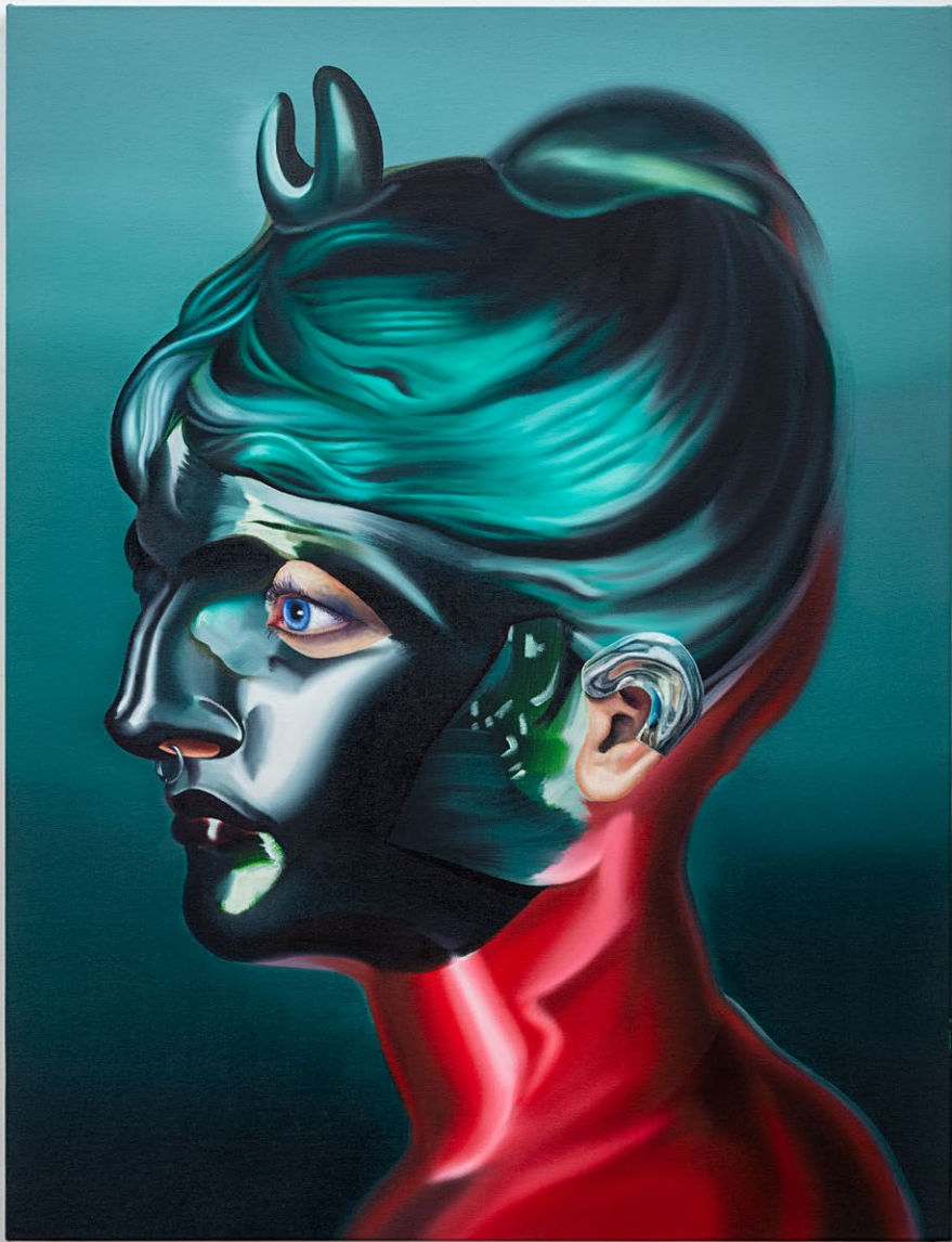
Artemis, 2026 tinta óleo sobre linho 130 x 100 cm