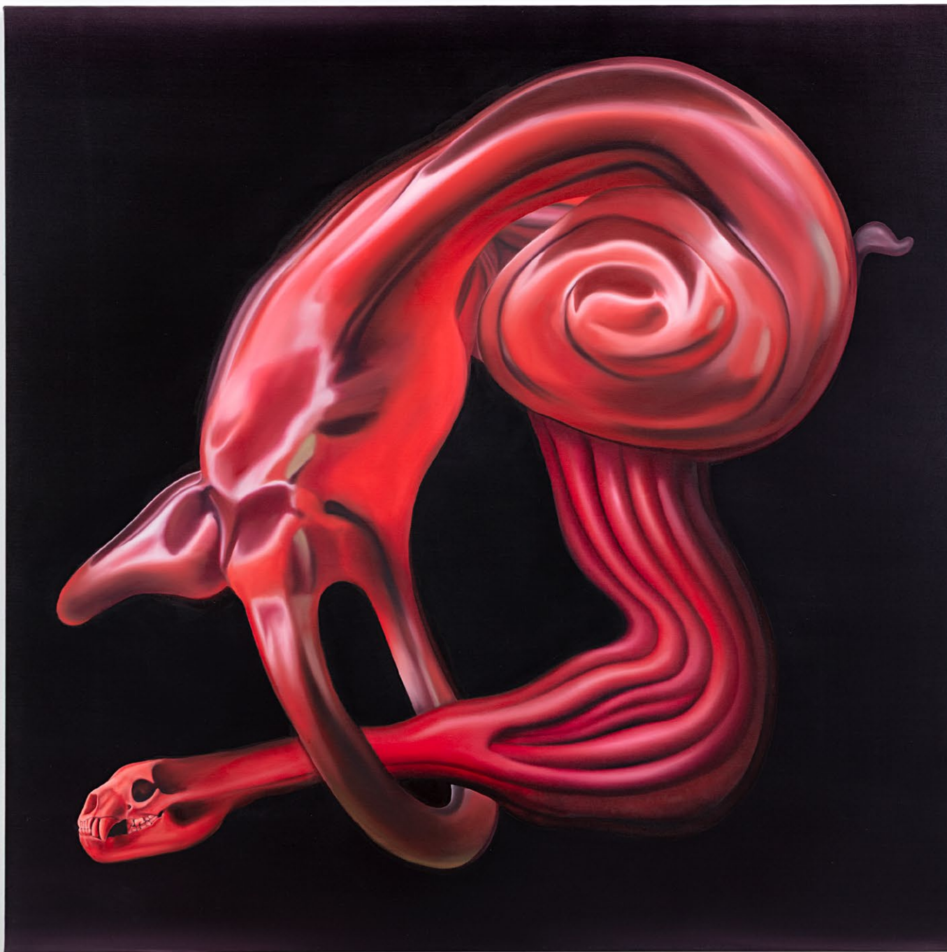
Sem título , 2026 tinta óleo sobre linho 140 x 100 cm