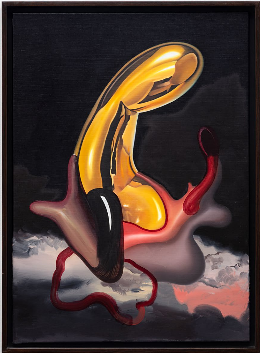
Brancusi volumen dick, 2025 tinta óleo sobre linho 70 x 50 cm