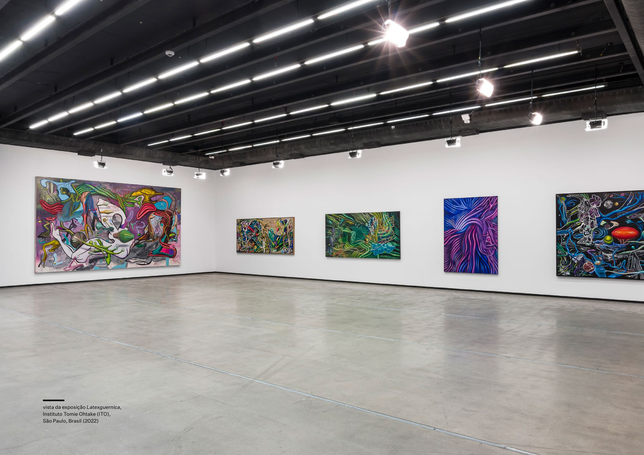
vista da exposição Latexguernica , Instituto Tomie Ohtake (ITO), São Paulo, Brasil (2022)