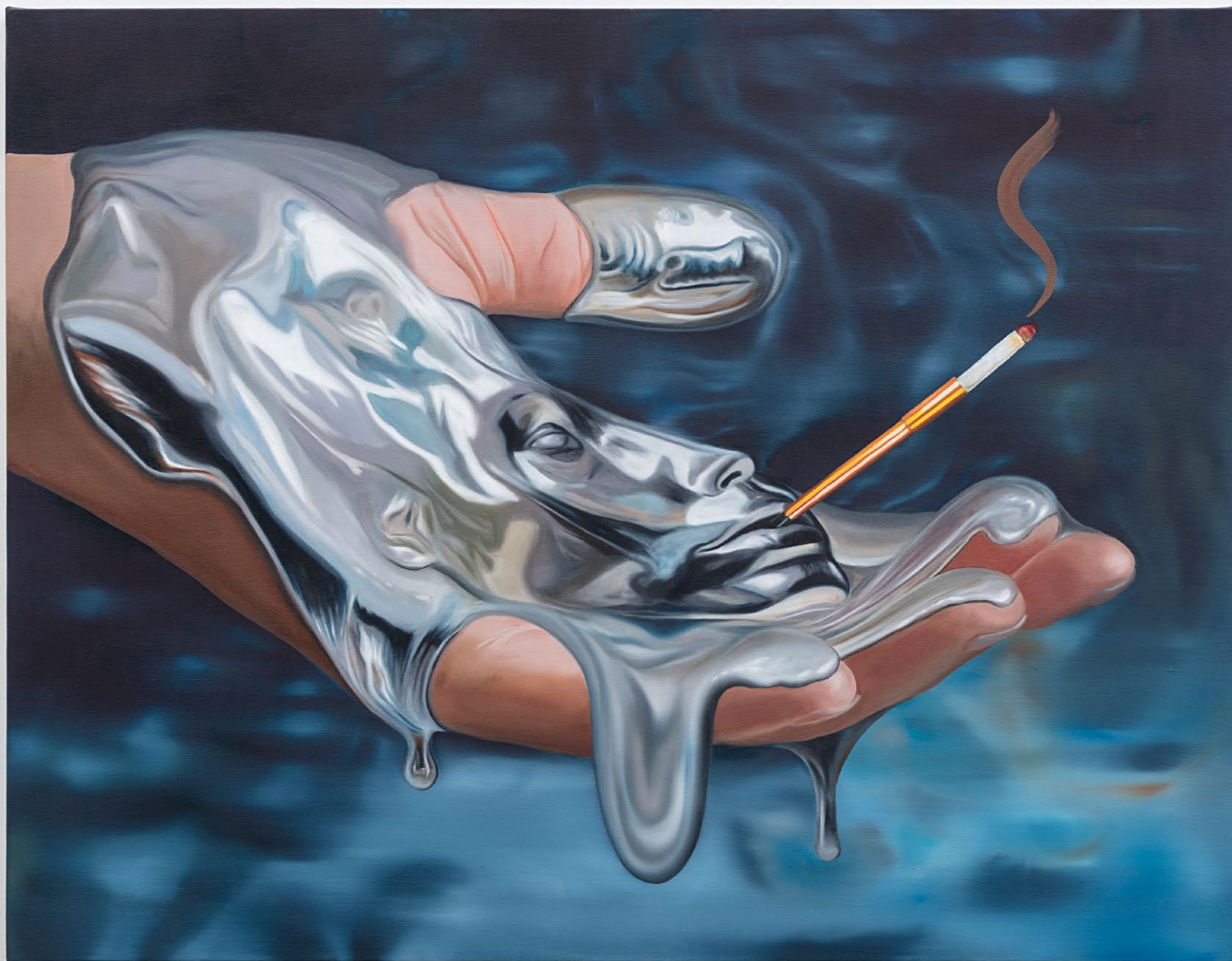
Fading mercury , 2026 tinta óleo sobre linho 100 x 130 cm