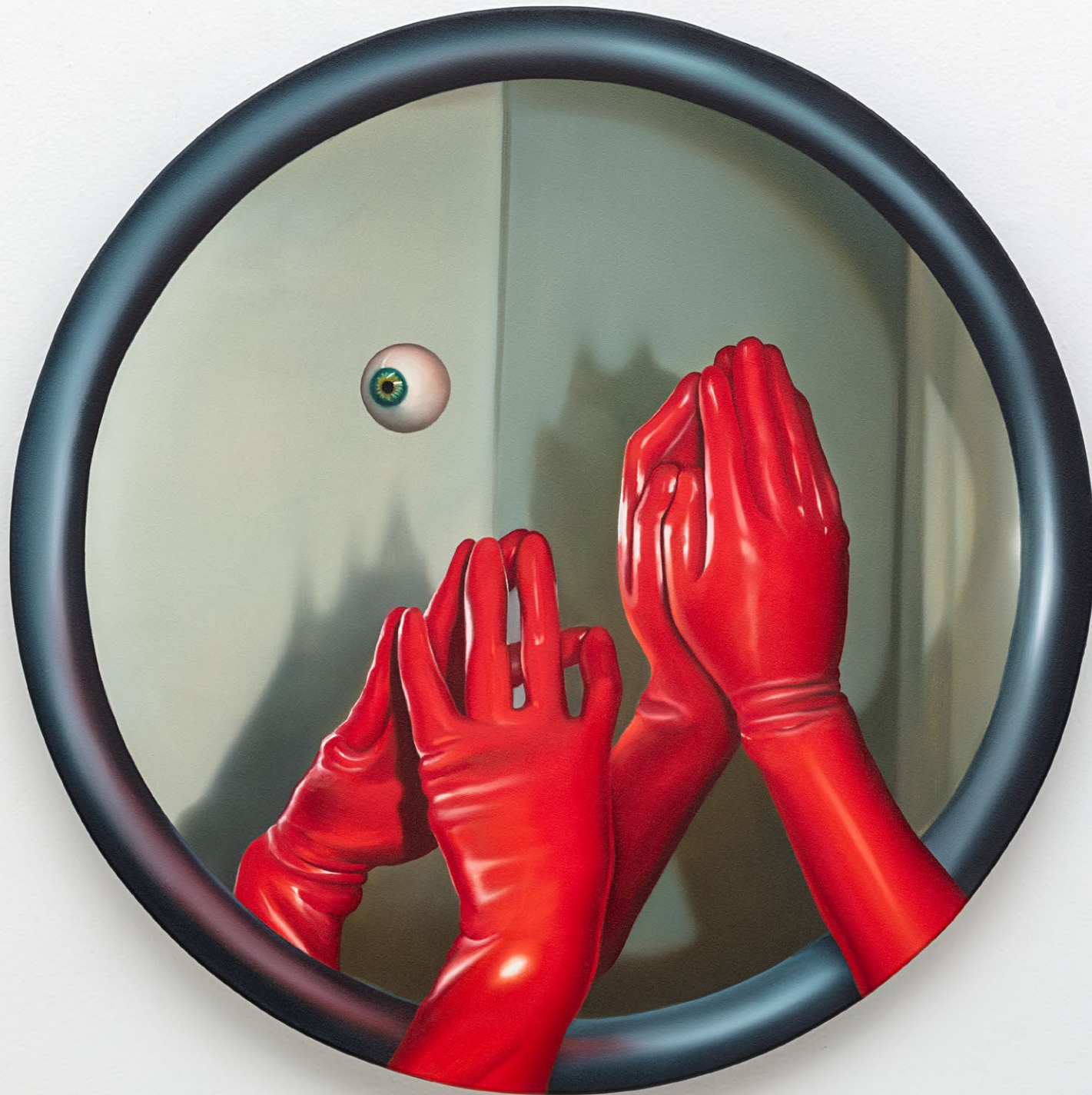
Red gloves ice, 2026 tinta óleo sobre linho Ø 70 cm