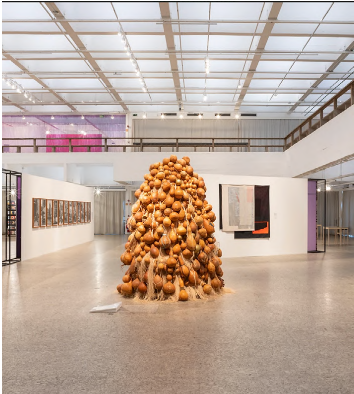
vista O Sorriso de Acotirene na exposição Histórias Feministas , MASP, 2019