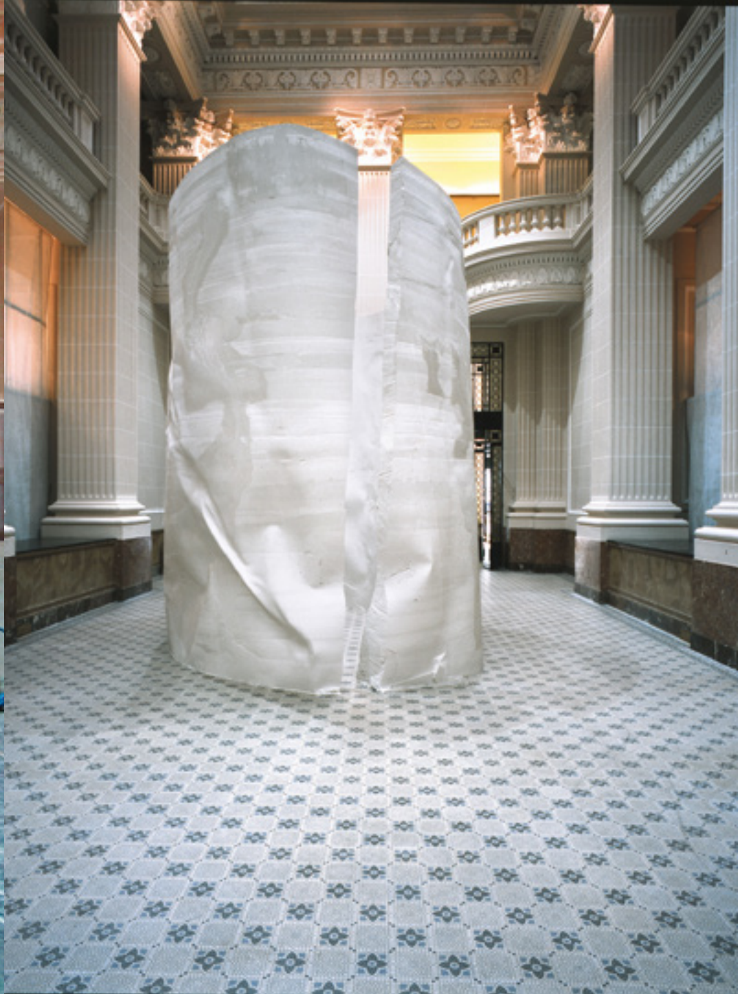
Exposição / Exhibition III Bienal do Mercosul, Porto Alegre, 2001 Curated by Fábio Magalhães