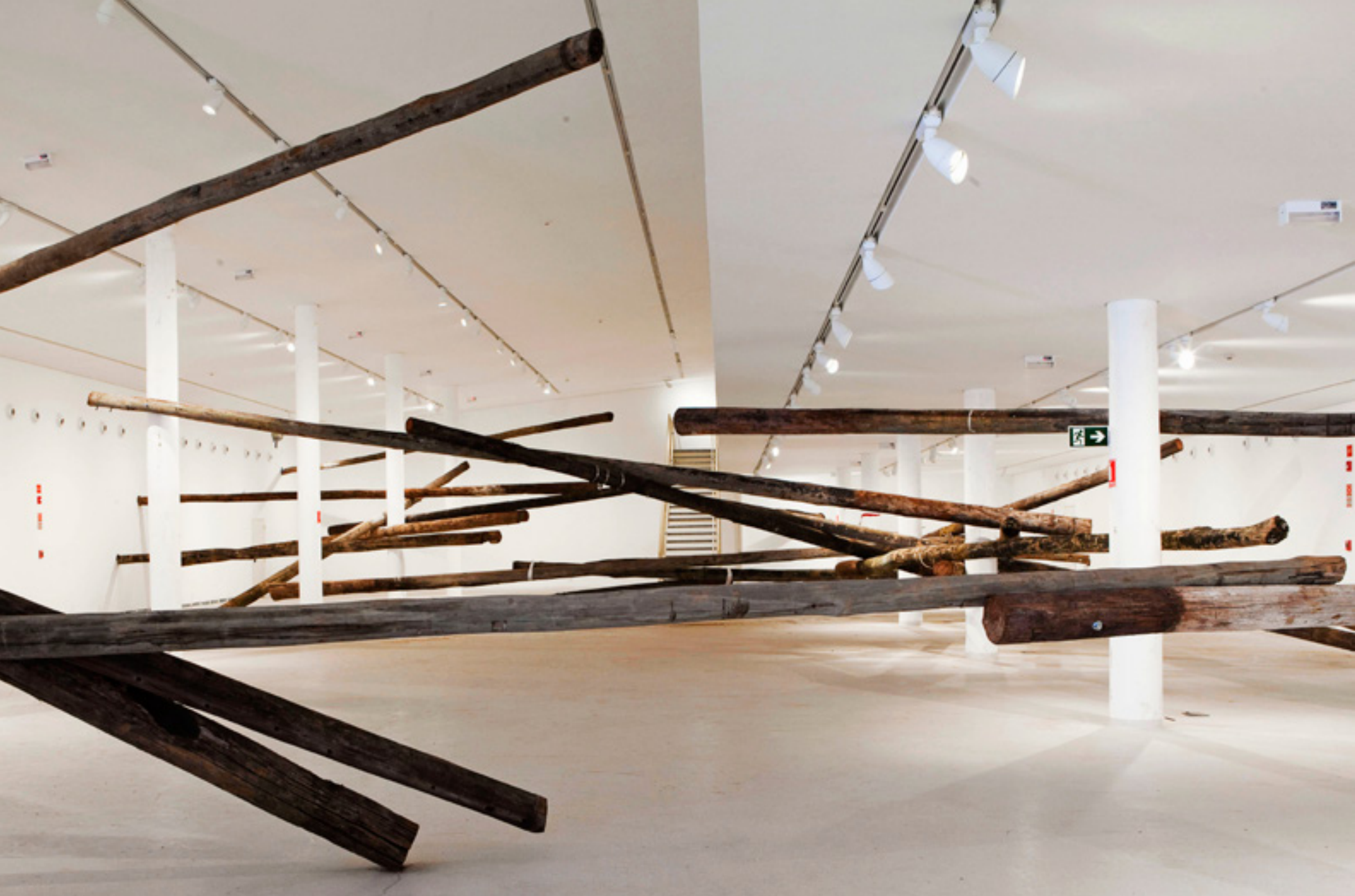
Sala de espera (Waiting room) 2013 24 postes de madeira/24 wooden used street posts -- dimensões variáveis /dimensions variable Vista da exposição/Exhibition view, MAC - USP