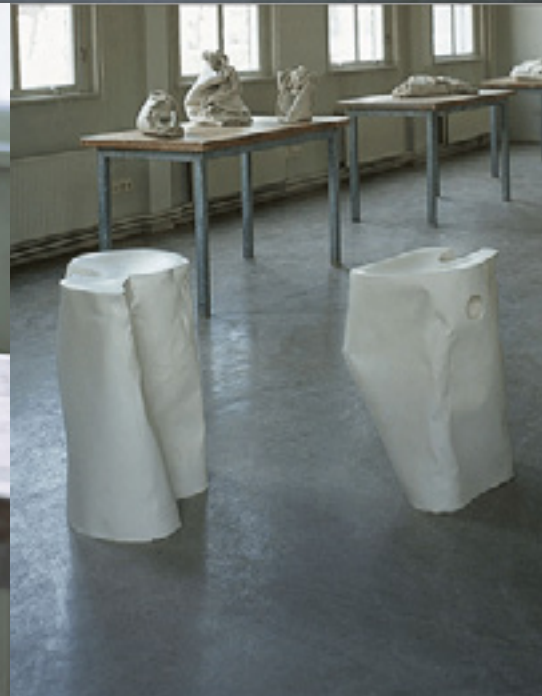
Exposição / Exhibition Carlito Carolhosa , Ekwc, Holanda, 2000 gesso, porcelana / plaster, porcelain