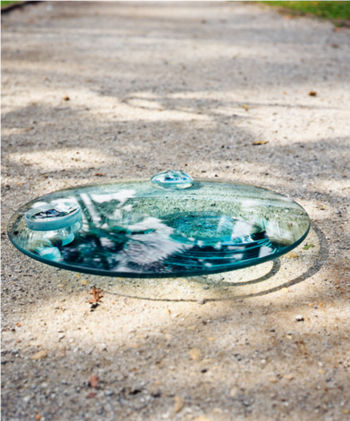
Lente 2011 lentes ópticas/optical lenses dimensões variáveis/variable dimensions