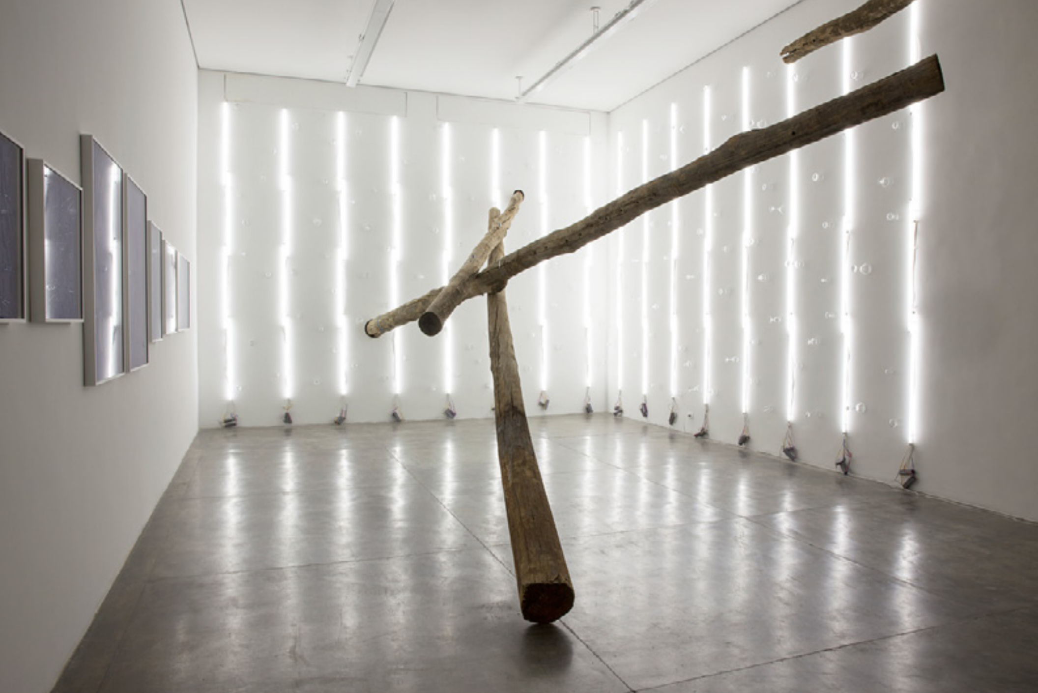
Precaução de contato 2014 postes de eucalipto usados/used eucalyptus posts -- dimensões variáveis site specific/variable dimensions, site specific