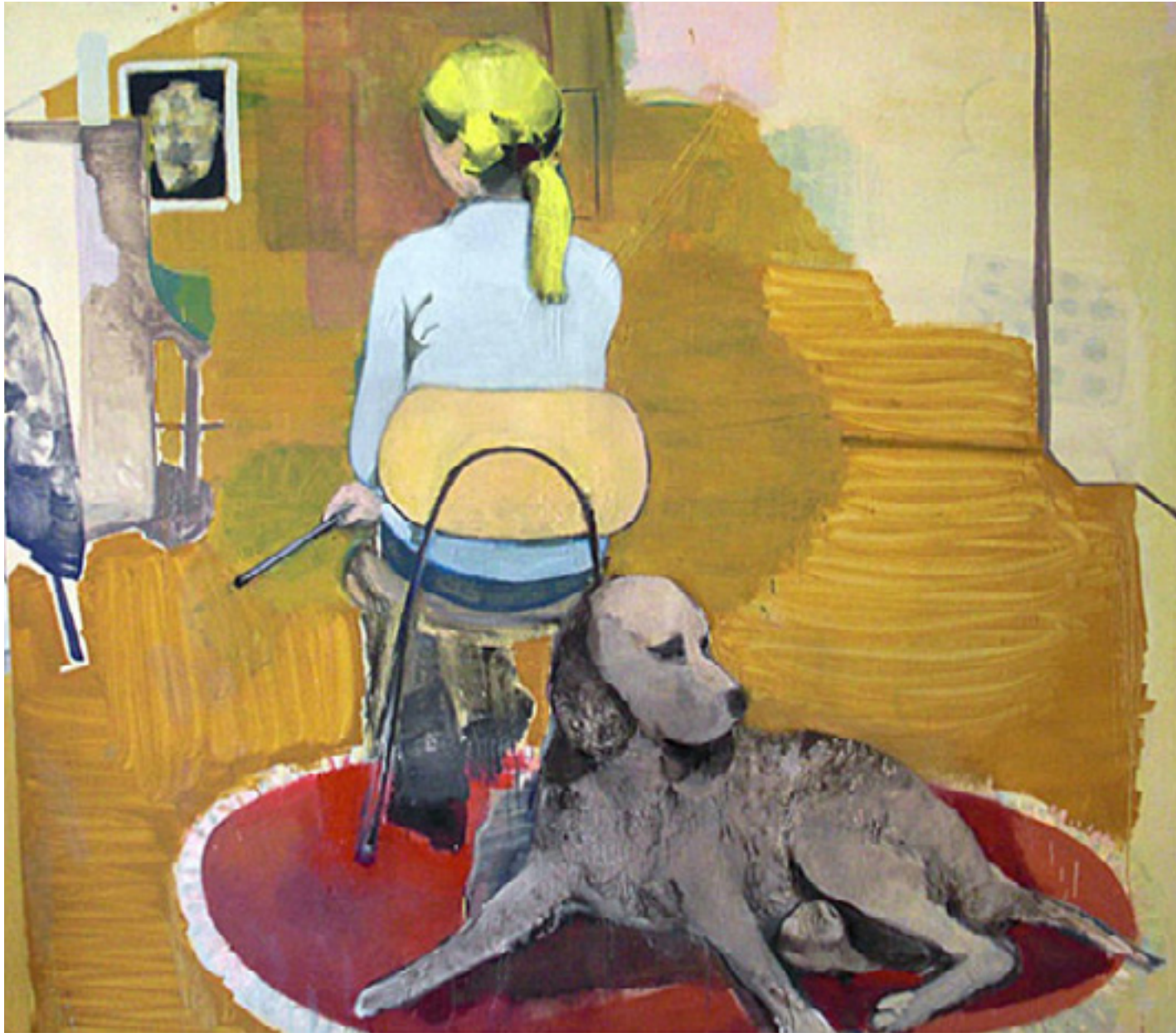
Espera 2009 -- técnica mista sobre tela/mixed media on canvas -- 175 x 200 cm