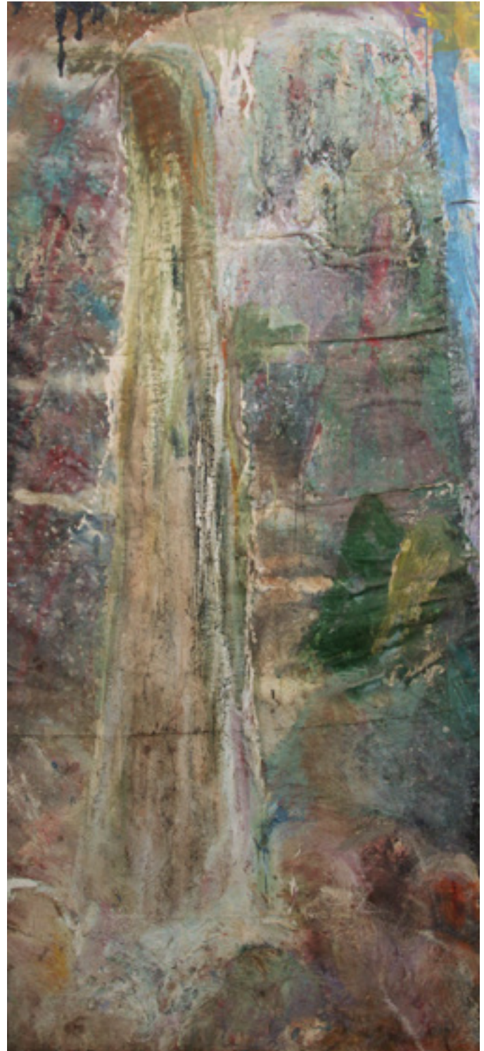
Queda 1990 acrílica, óleo e esmalte sobre lona e gobelin/ acrylic, oil and enamel on linen and gobelin 250 x 115 cm