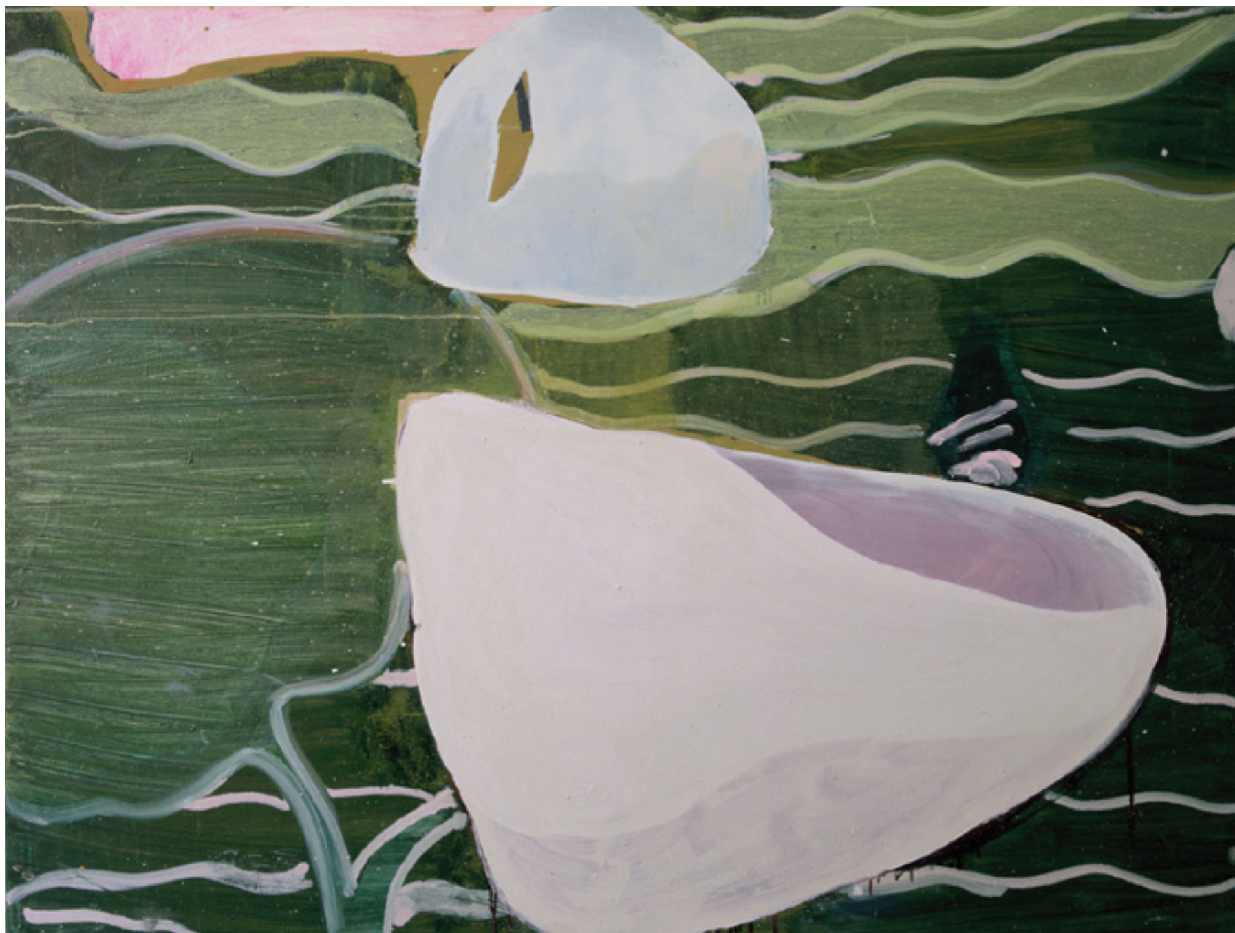
Estórias do mar 1999 óleo sobre tela/oil on canvas -- 110 x 145 cm