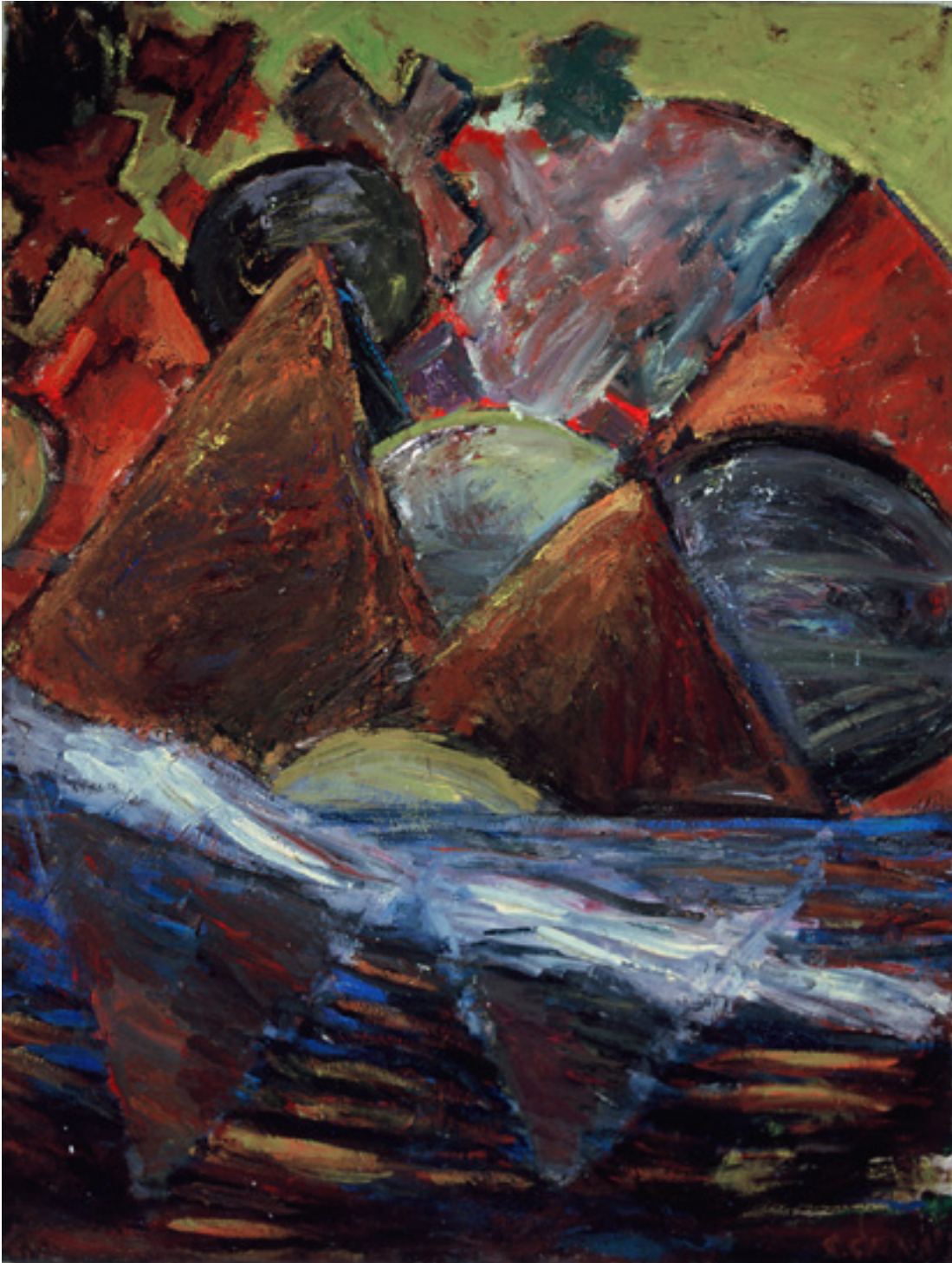
Vera cruz 1985 óleo sobre tela/oil on canvas 210 x 160 cm