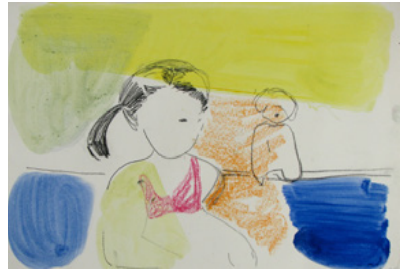
sem título/untitled 2006 técnica mista sobre papel/mixed media on paper 30 x 42 cm