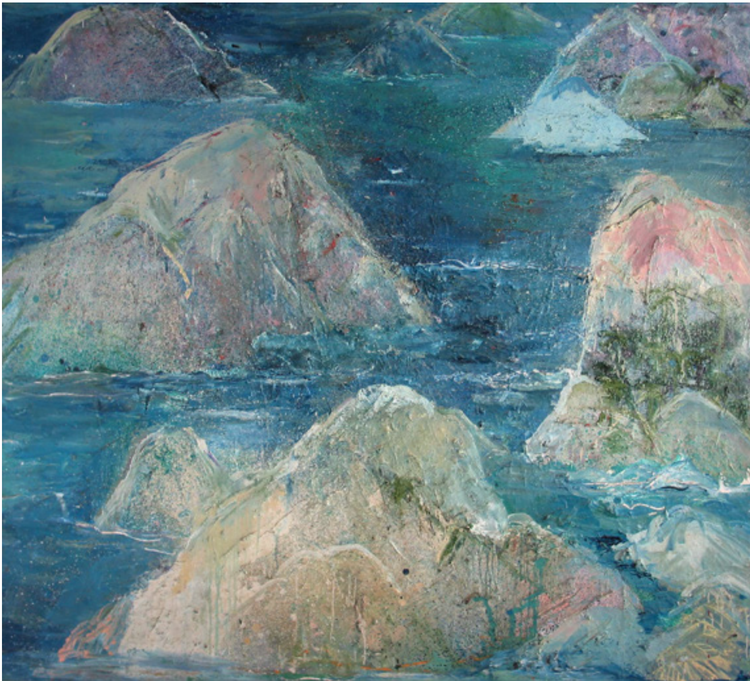
Mar Calmo, Àguas Profundas 1990 técnica mista sobre tela/mixed media on canvas -- 205 x 186 cm