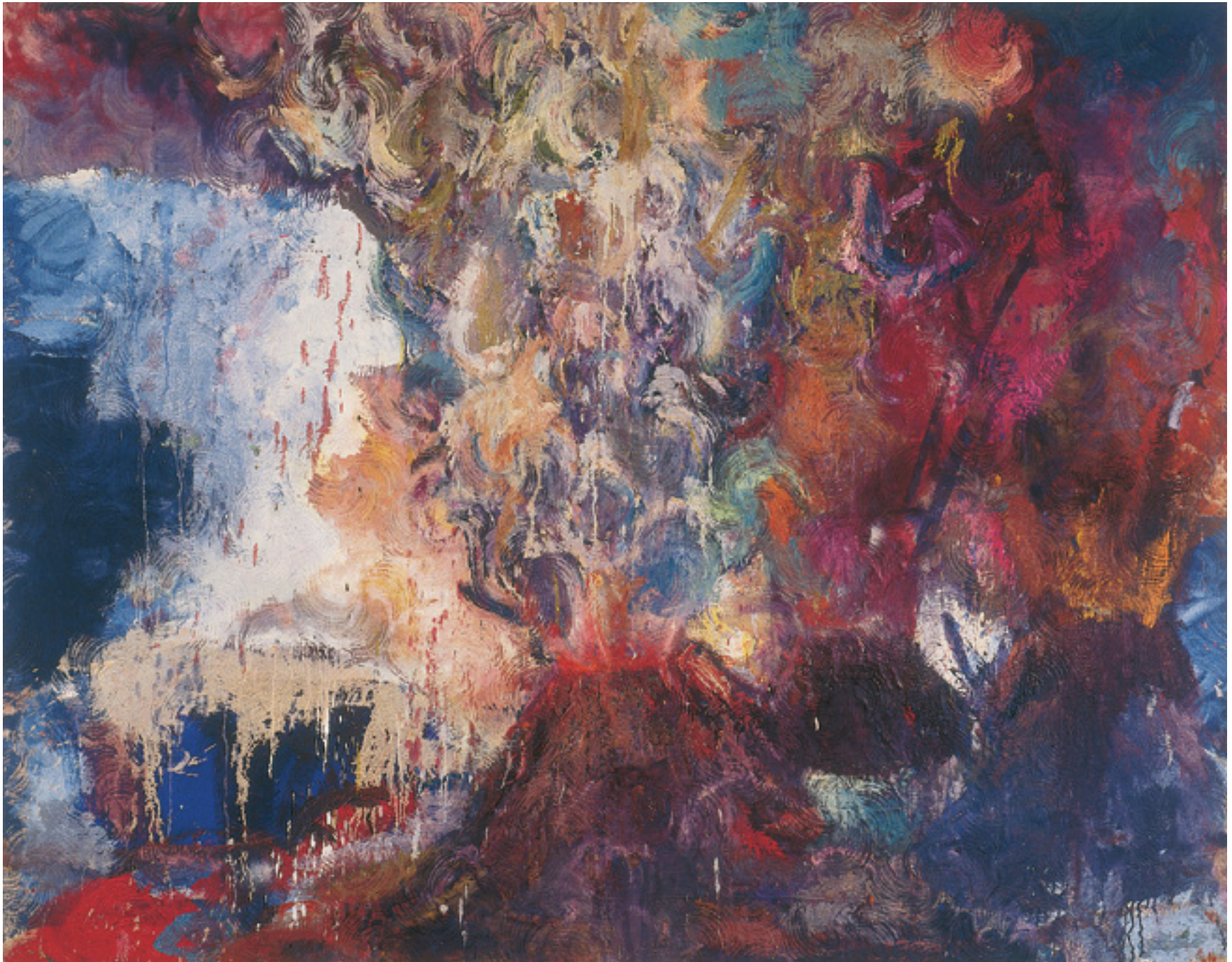
We are the children 1988 técnica mista sobre tela/mixed media on canvas -- 180 x 230 cm