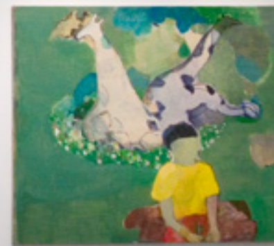
Cristina Canale 2007 -- Instituto Tomie Ohtake vista da exposição/exhibition view