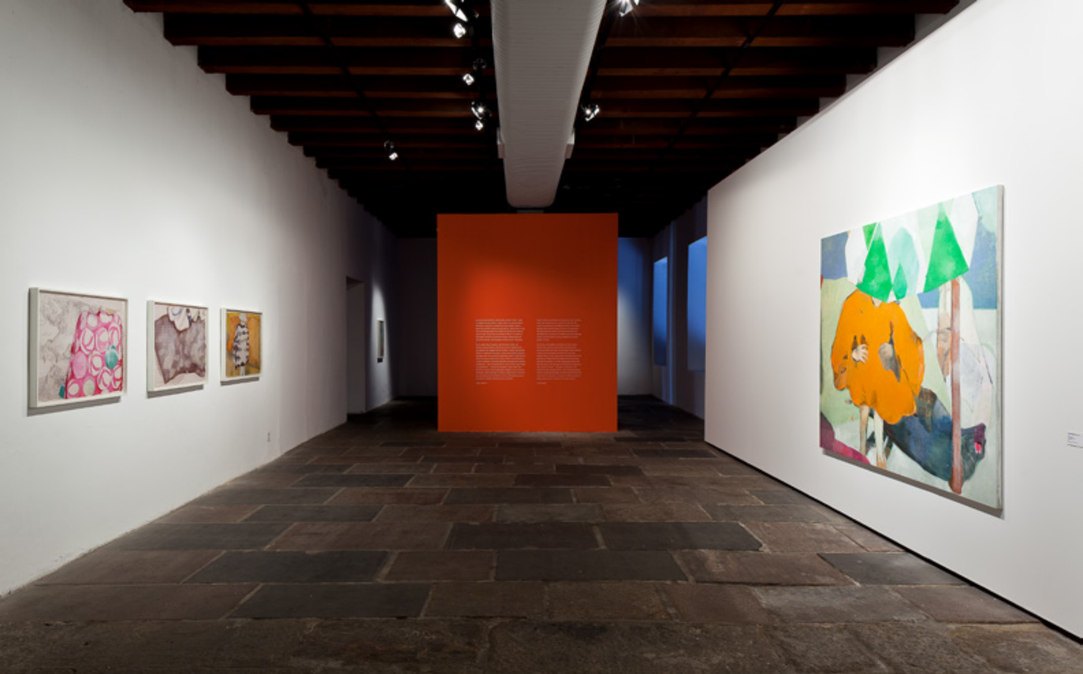
Entremundos 2014 -- Paço Imperial, Rio de Janeiro vista da exposição/exhibition view