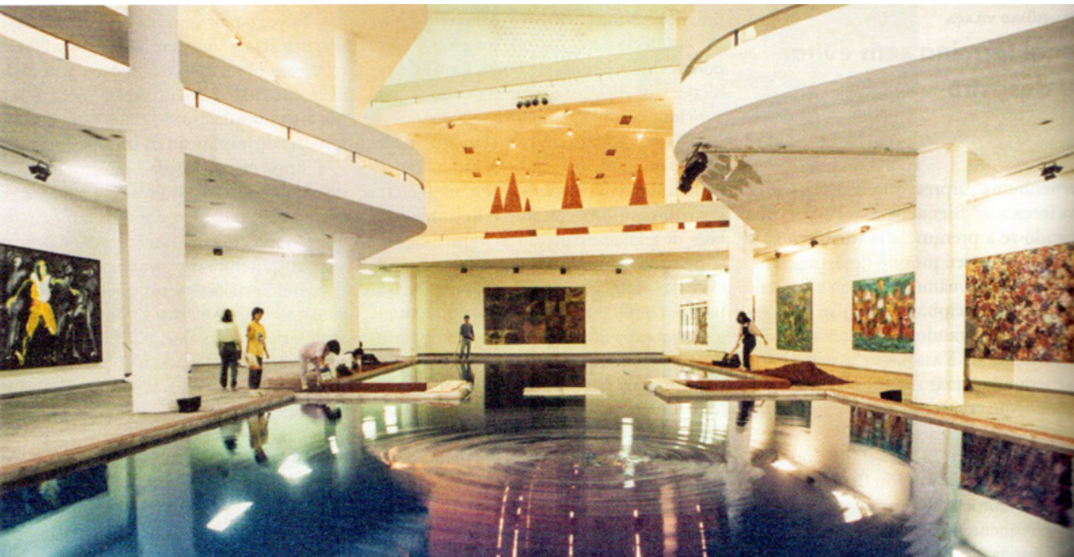
21 Bienal de São Paulo, 1991 -- vista da exposição/exhibition view