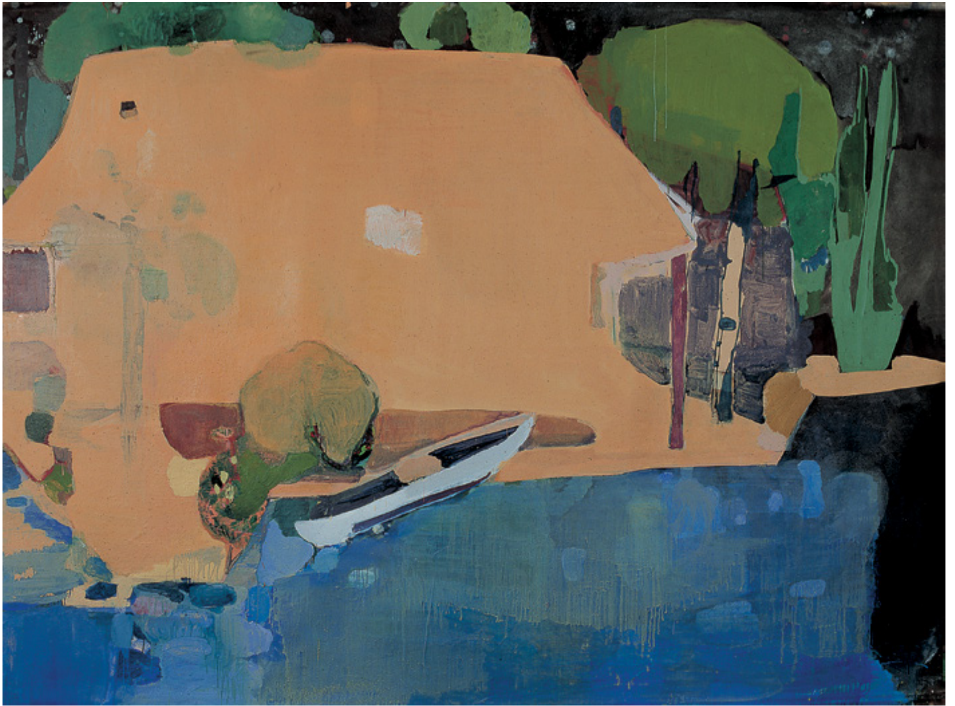
Casa de amigo II, 2004 -- óleo sobre tela/oil on canvas -- 200 x 260 cm