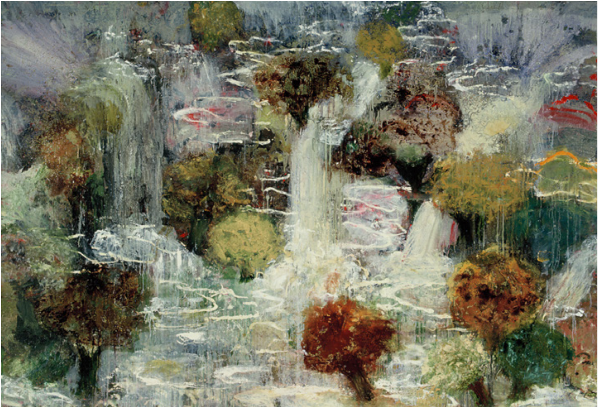
Brasilianas 1992 -- óleo e esmalte sobre tela/oil and enamel on canvas -- 240 x 350 cm