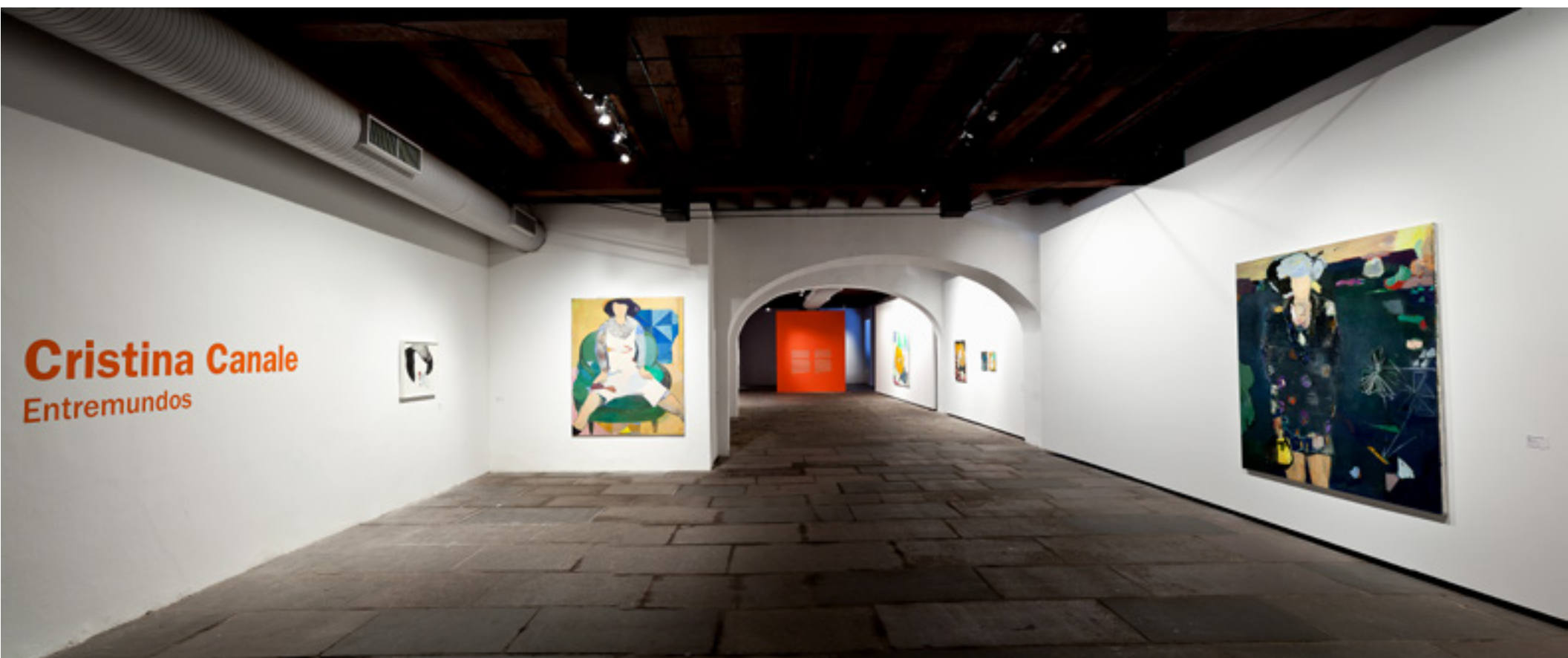
Entremundos 2014 -- Paço Imperial, Rio de Janeiro vista da exposição/exhibition view