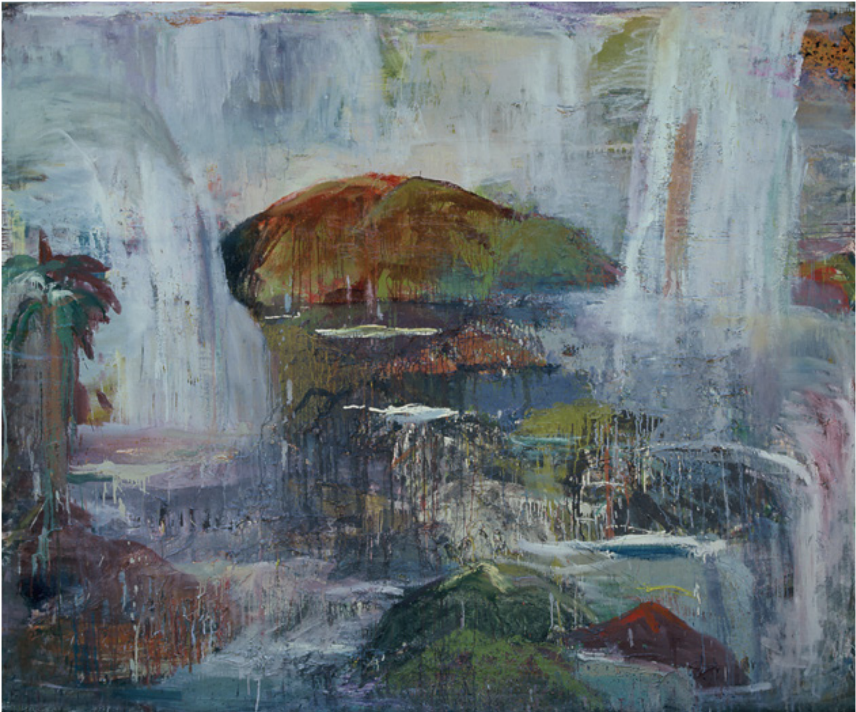
Reencuentro 1990 técnica mista sobre tela/mixed media on canvas -- 239 x 282 cm