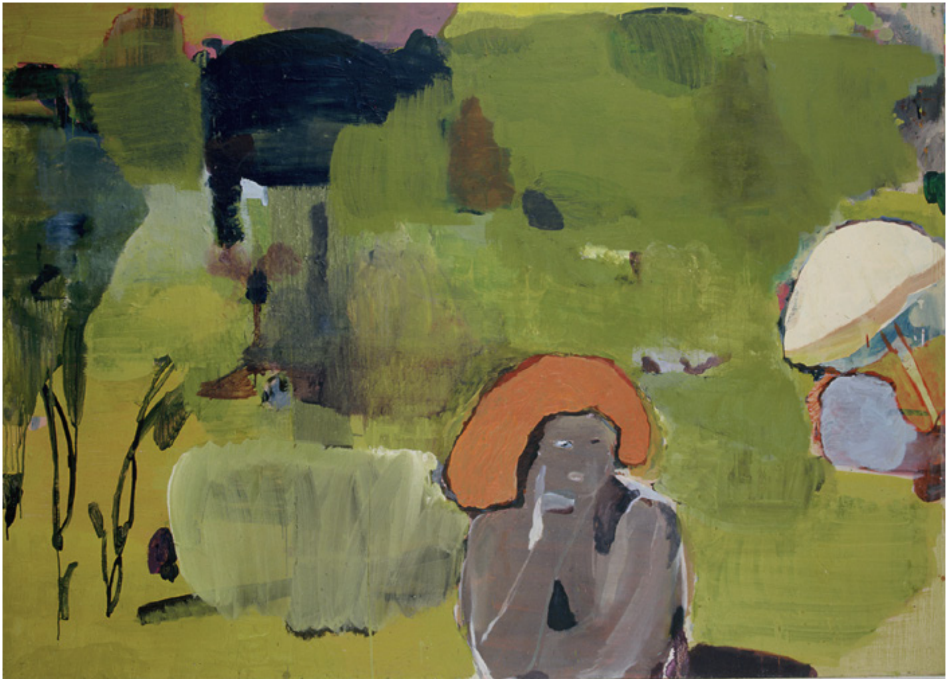
A observadora 2003 -- técnica mista sobre tela/mixed media on canvas -- 140 x 195 cm