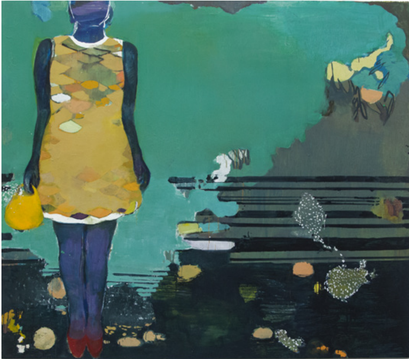
Menina de netuno 2012 /2013 -- técnica mista sobre tela/mixed media on canvas -- 175 x 200 cm