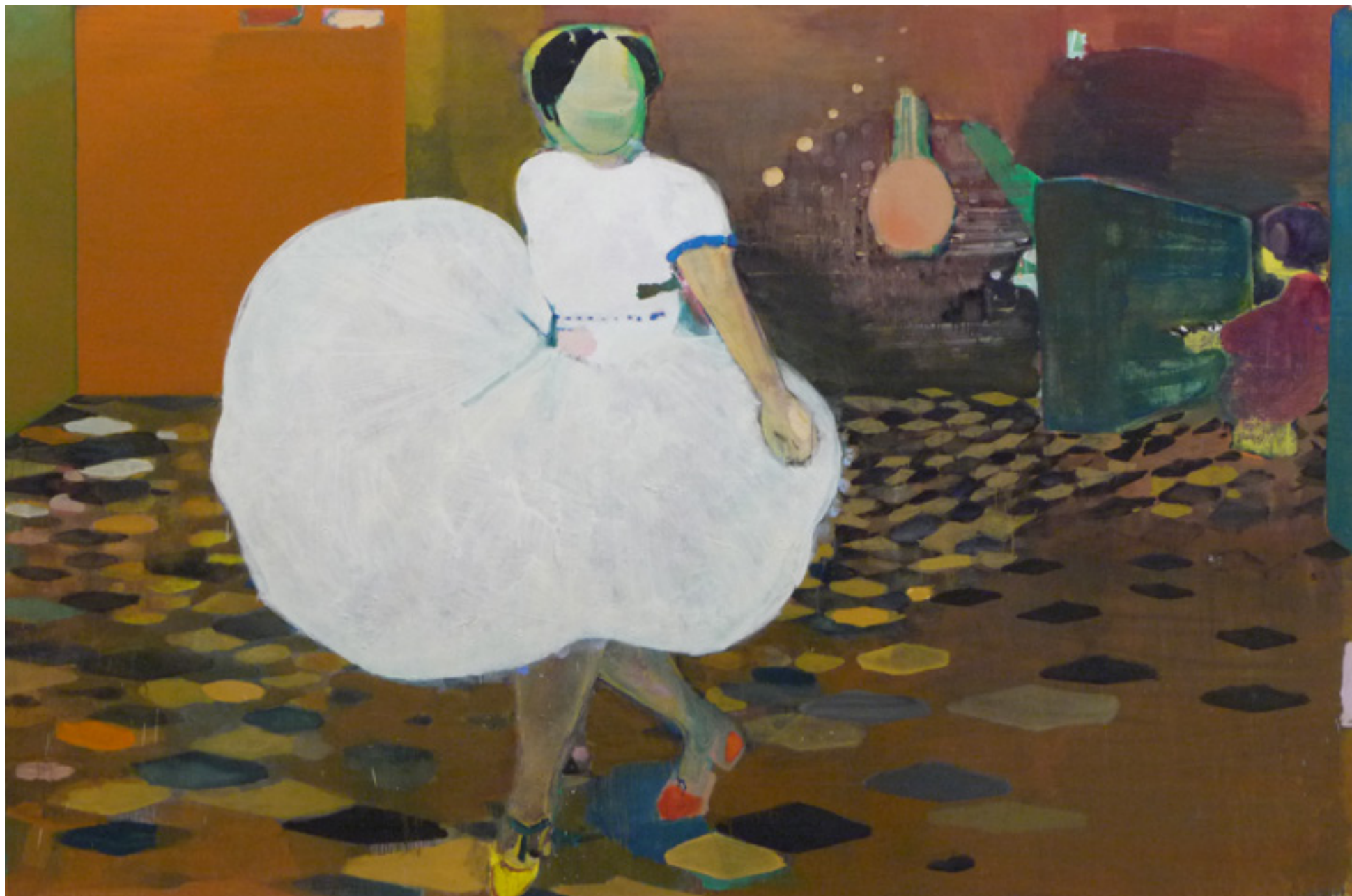
Passante 2010/2011 -- acrílica, óleo e bastão de tinta sobre tela/acrylic, oil and paint stick on canvas -- 200 x 300 cm