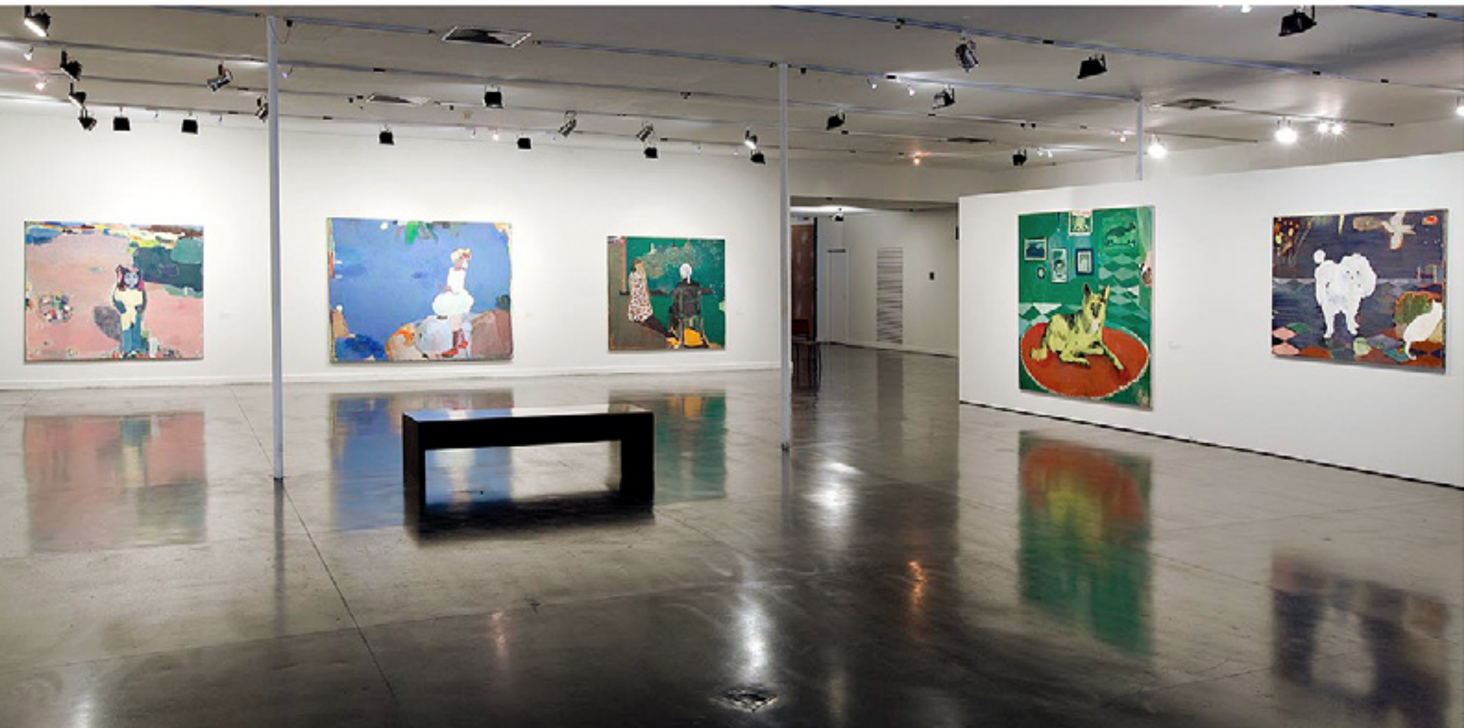
Arredores e Rastros 2010 -- MAM Rio de Janeiro vista da exposição/exhibition view