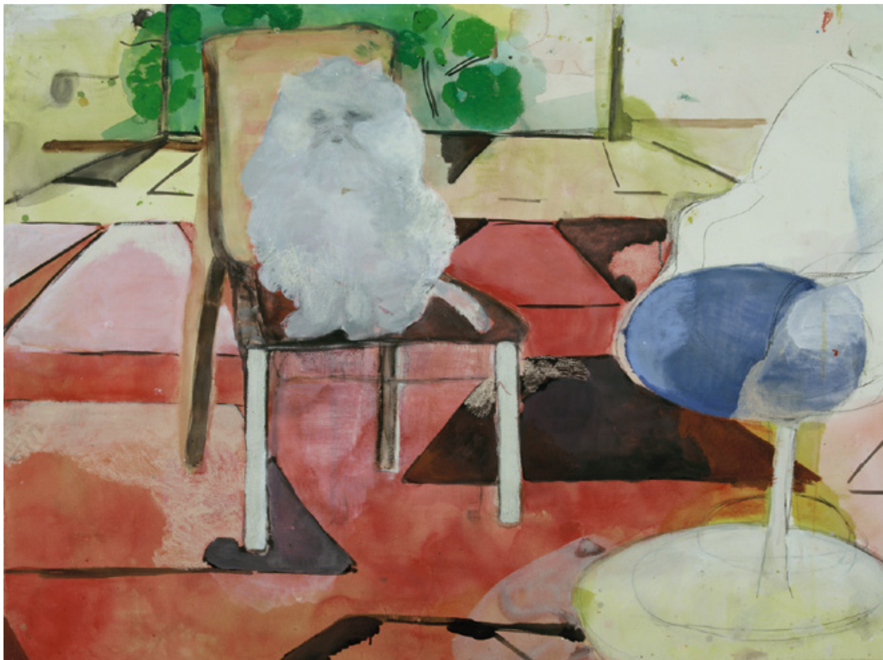
Moderno 2008 -- técnica mista sobre papel/mixed media on paper -- 114 x 147 cm