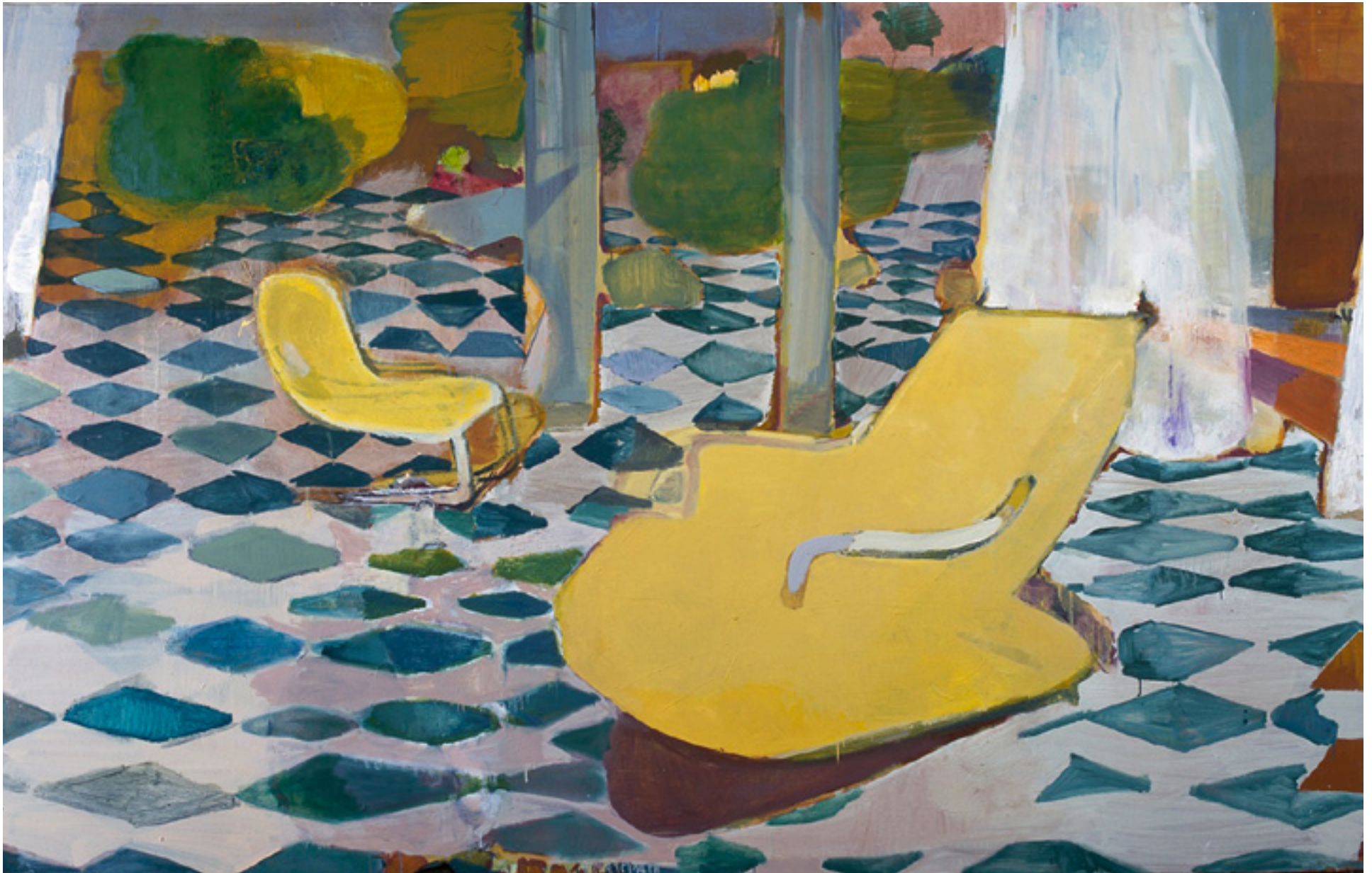
Ninguém em casa 2010 técnica mista sobre tela/mixed media on canvas -- 170 x 260 cm