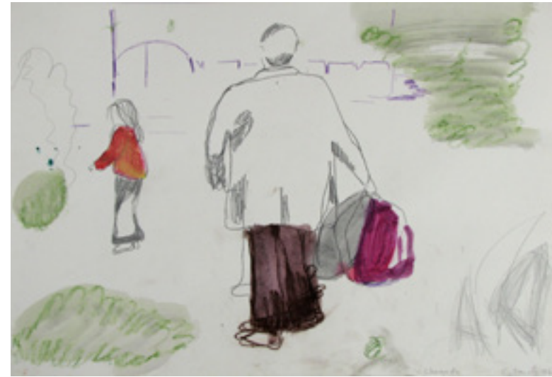
sem título/untitled 2006 técnica mista sobre papel/mixed media on paper 30 x 42 cm