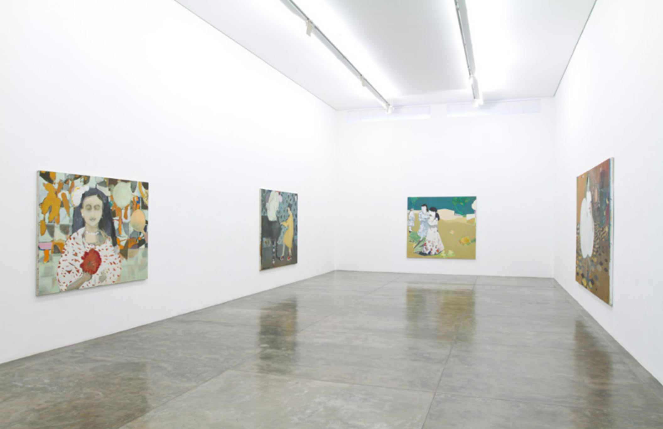
Sem palavras 2011 -- Galeria Nara Roesler, São Paulo vista da exposição/exhibition view