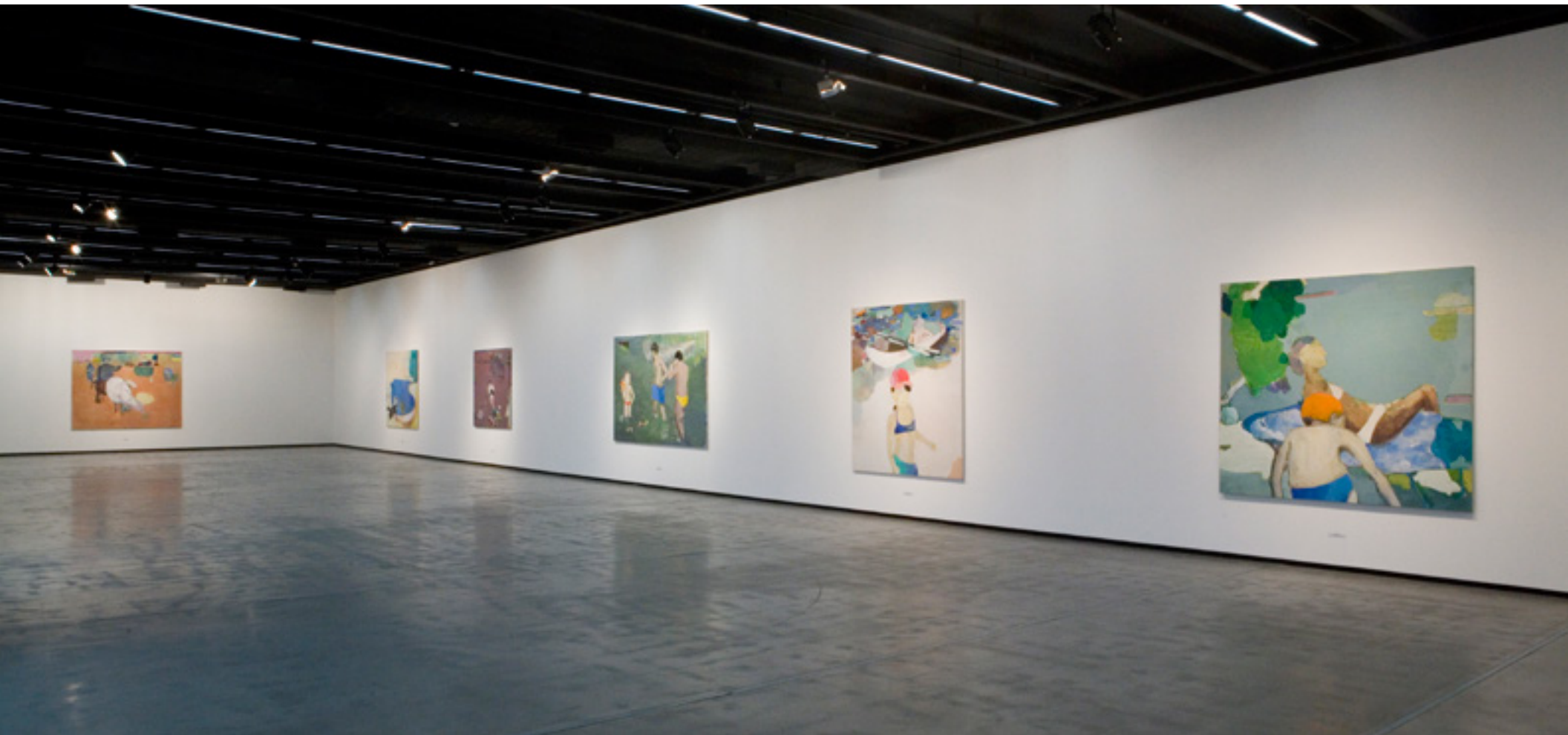
Cristina Canale 2007 -- Instituto Tomie Ohtake vista da exposição/exhibition view