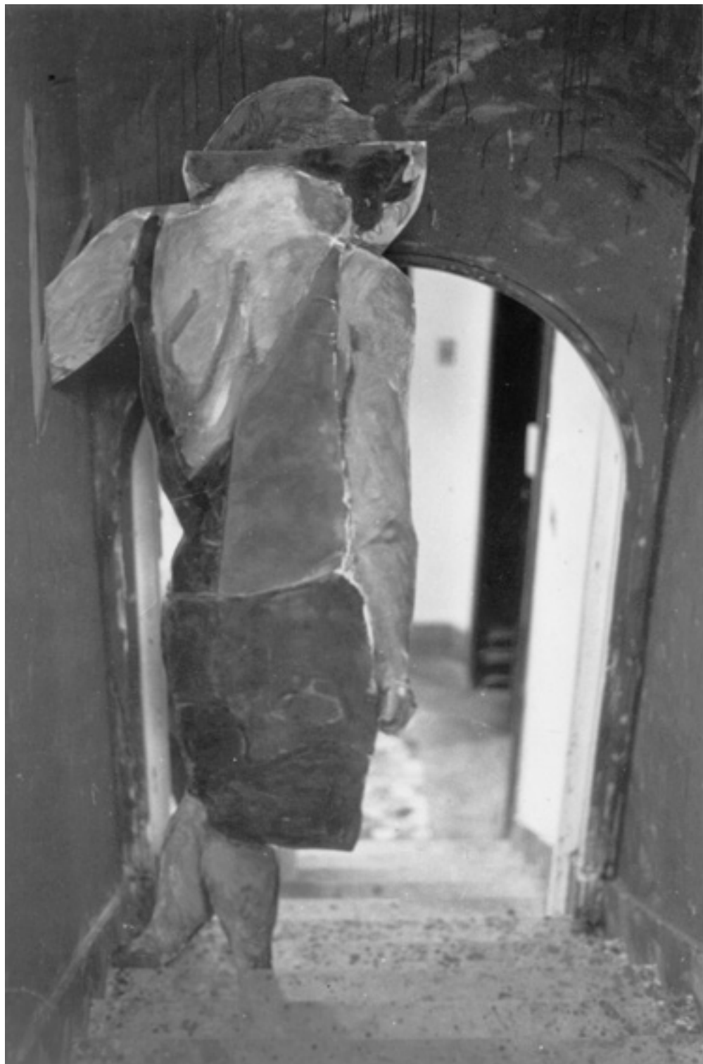
sem título/untitled -- instalação/installation -- Como Vai Você?, Geração 80 , Escola de Artes Visuais do Parque Lage, Rio de Janeiro, Brazil