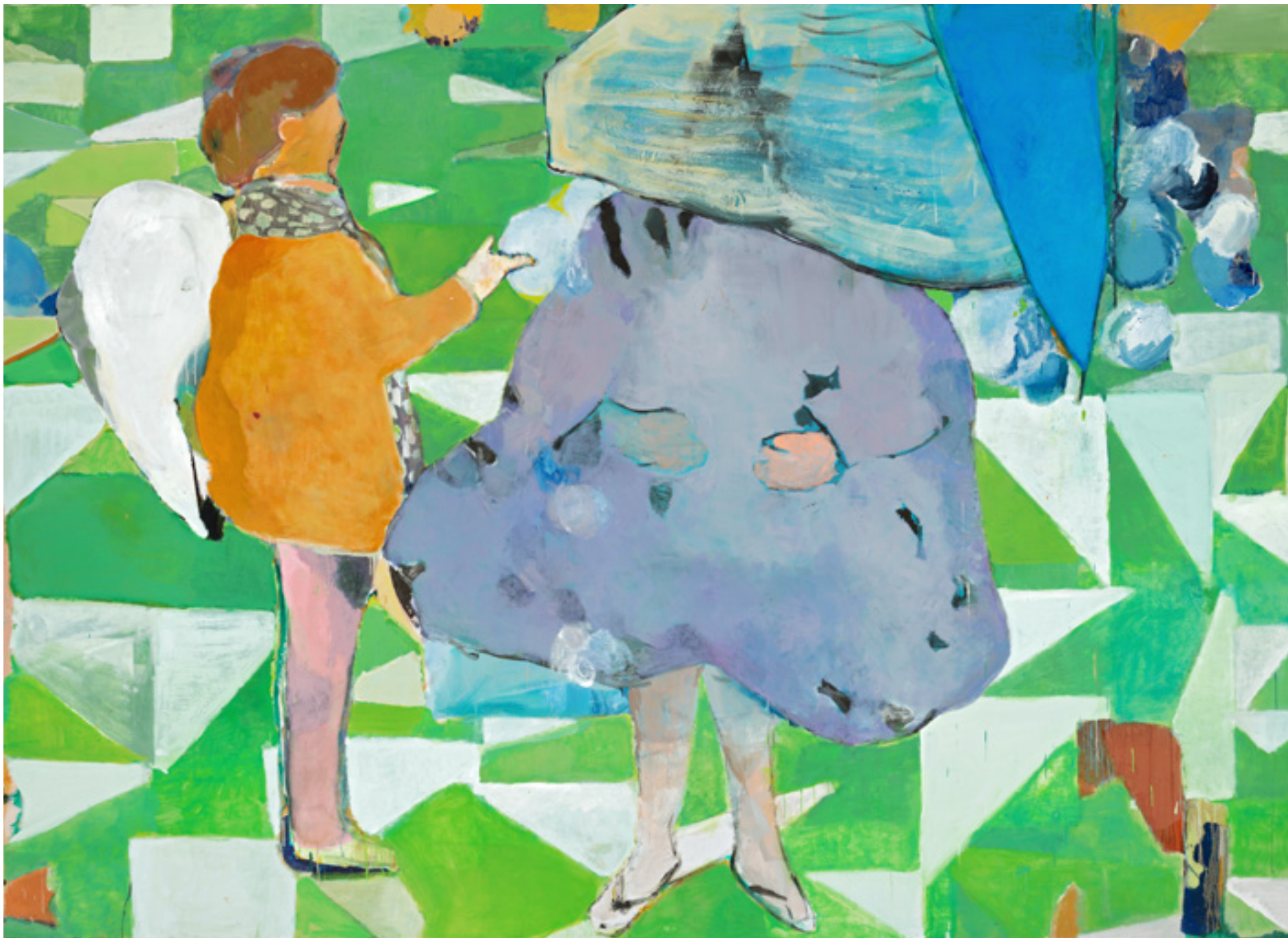
Anjo 2014 -- técnica mista sobre tela/mixed media on canvas 200 x 300 cm