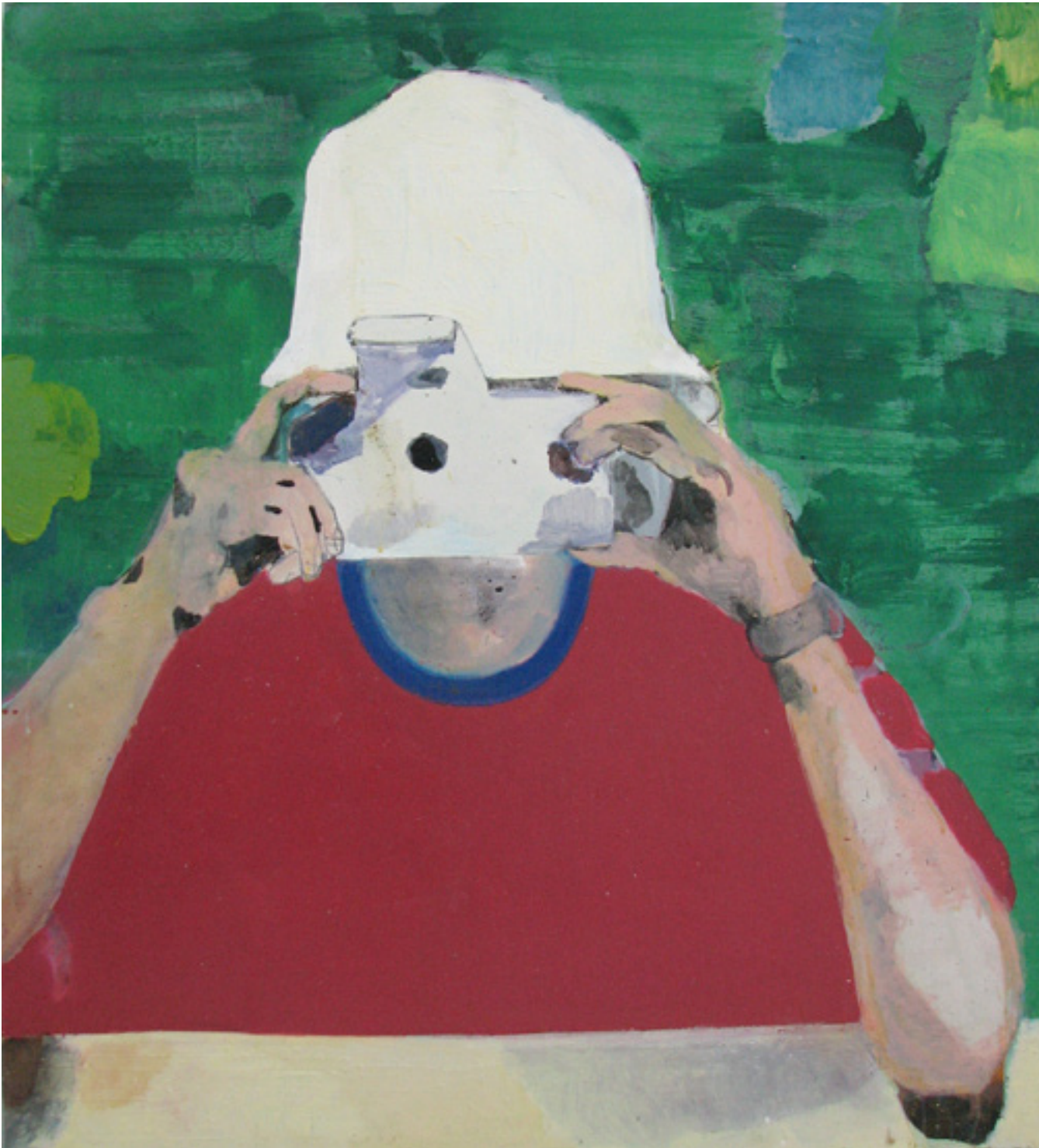
Turista em ação 2006 técnica mista sobre tela/ mixed media on canvas 120 X 110 cm