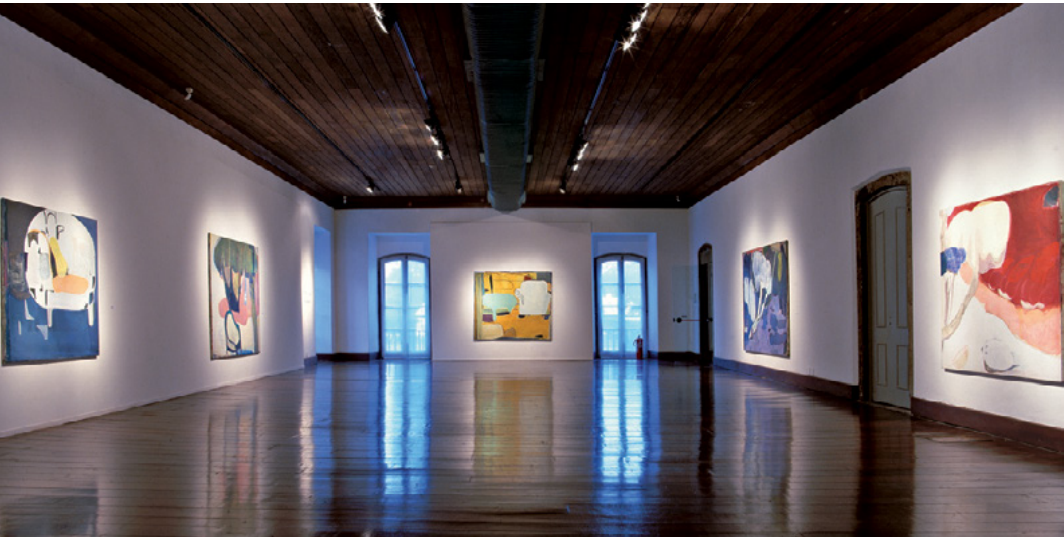
Amor Proibido, 2000 -- Paço Imperial vista da exposição / exhibition view