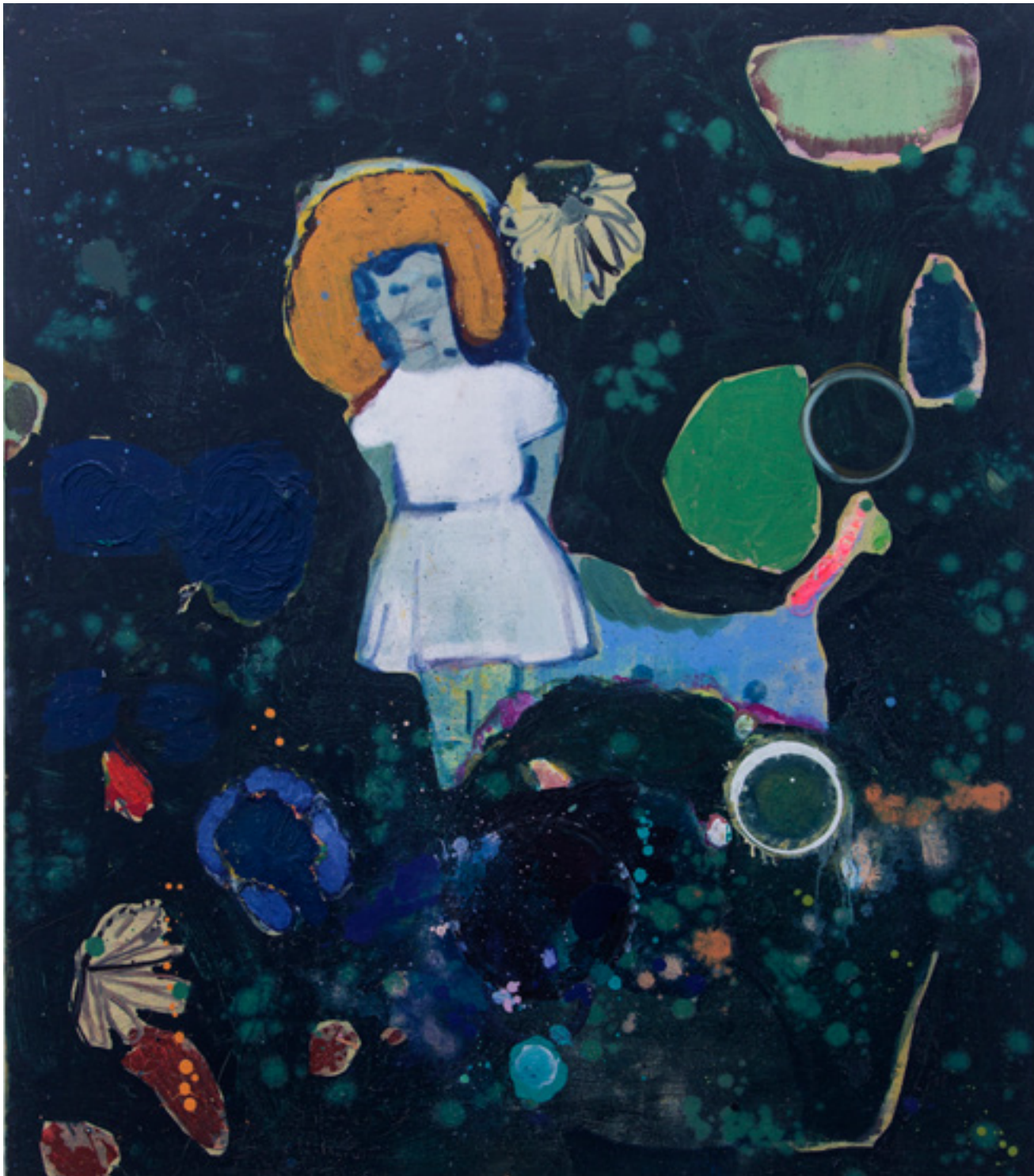
Menina de Plutão 2003 técnica mista sobre tela/ mixed media on canvas 120 x 105 cm