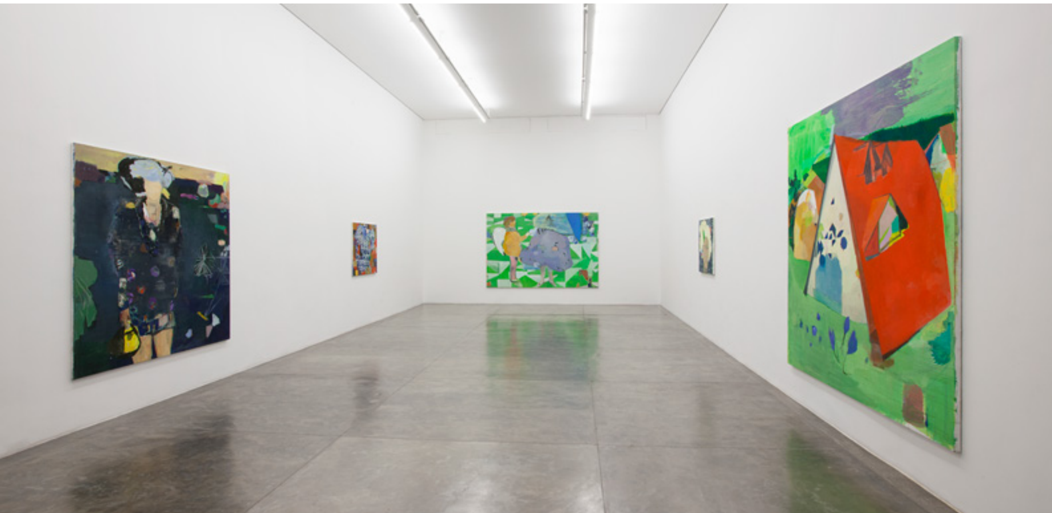
Entre o ser e as coisas 2014 -- Galeria Nara Roesler, São Paulo vista da exposição/exhibition view