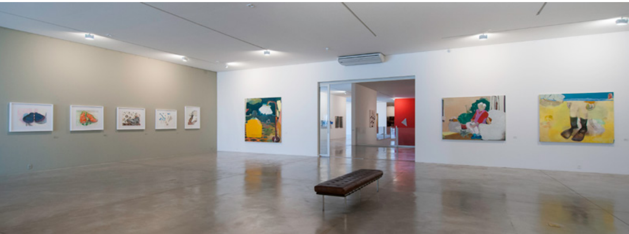
O protagonista e domingo 2013 -- Instituto Figueiredo Ferraz vista da exposição / exhibition view