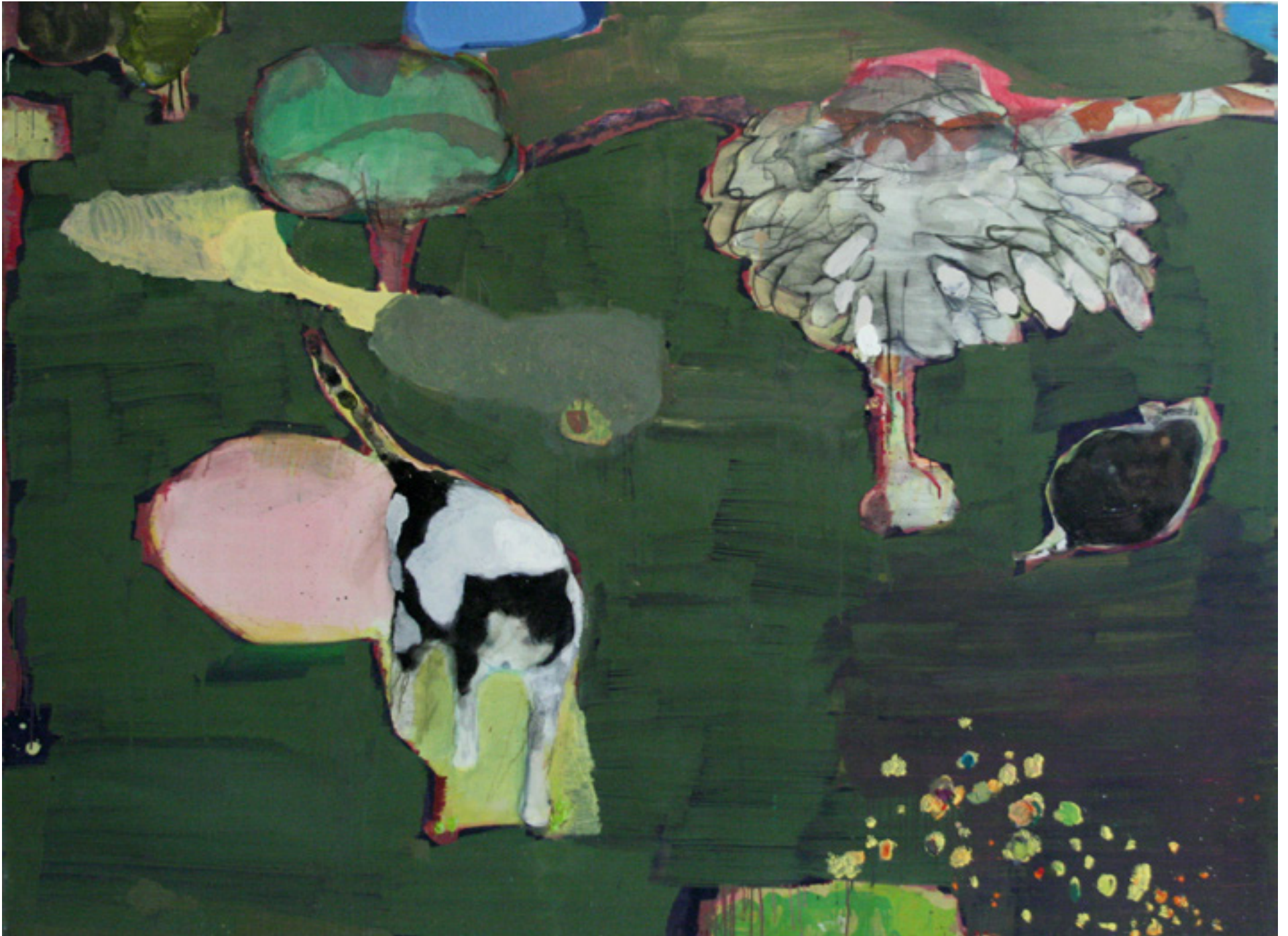
Gato e rato 2006 -- técnica mista sobre tela/mixed media on canvas -- 140 x 179 cm