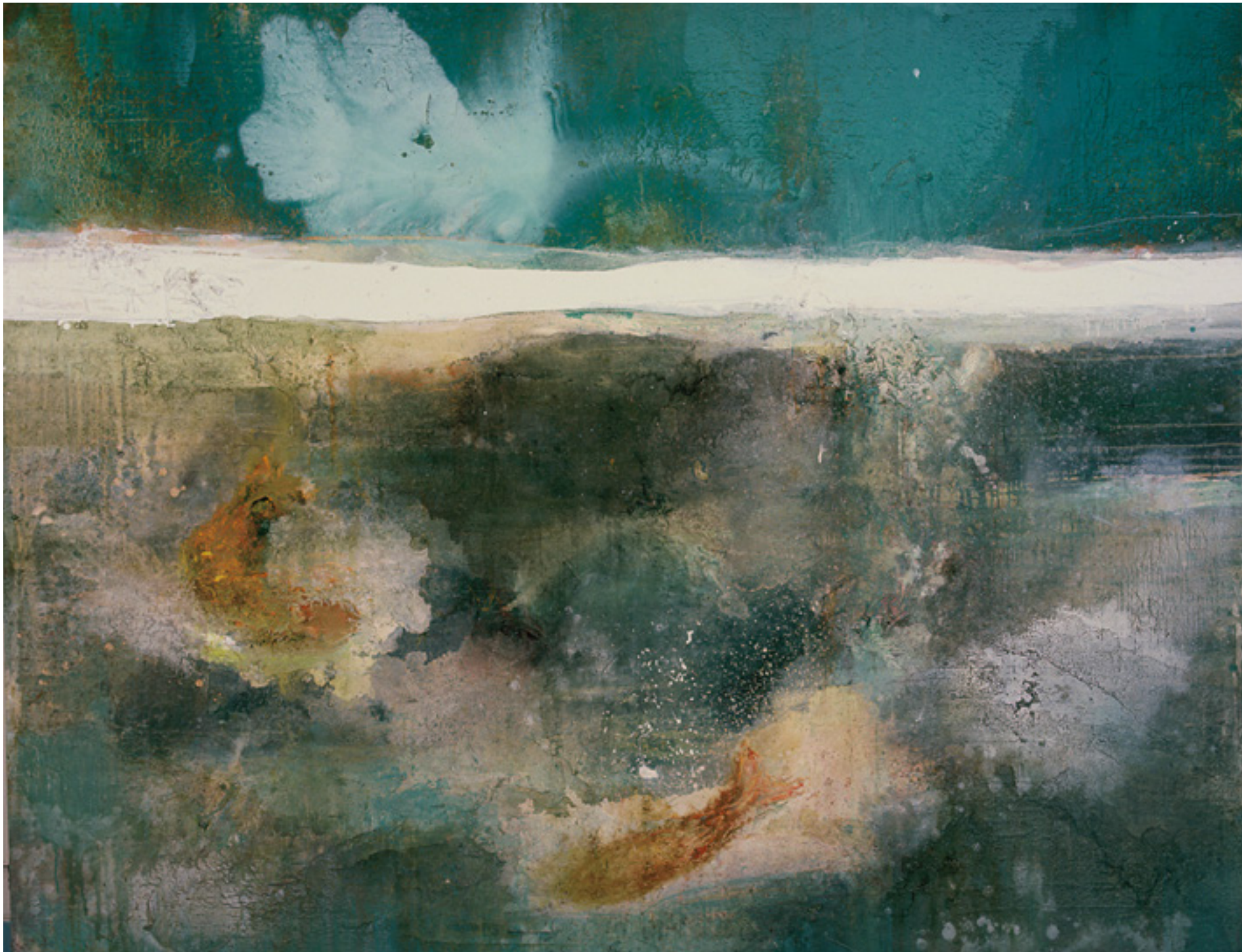
Olhos 1993 -- óleo e esmalte sobre tela/oil and enamel on canvas -- 190 x 240 cm