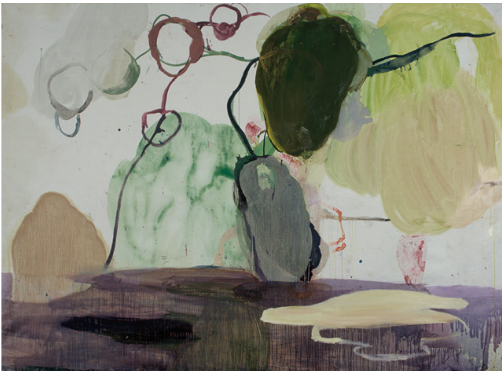
sem título/untitled 1995 -- técnica mista sobre tela/mixed media on canvas -- 200 x 260 cm