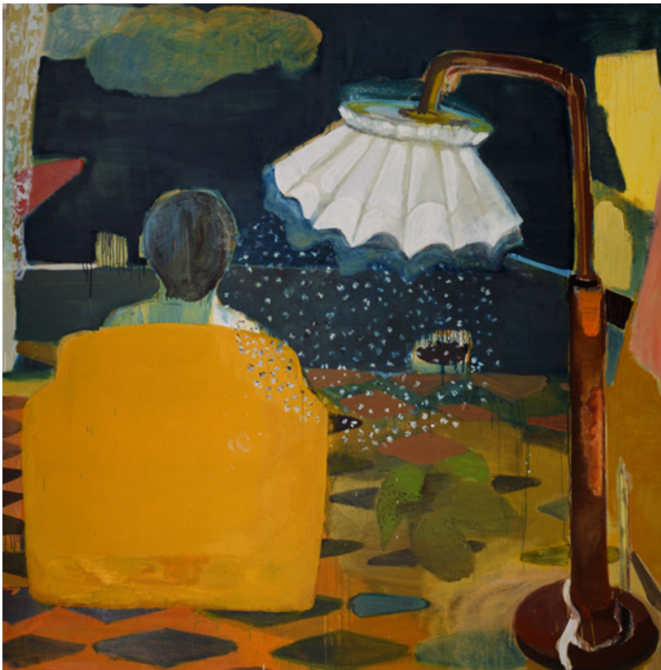
La chair est triste 2010 técnica mista sobre tela/mixed media on canvas -- 200 x 200 cm