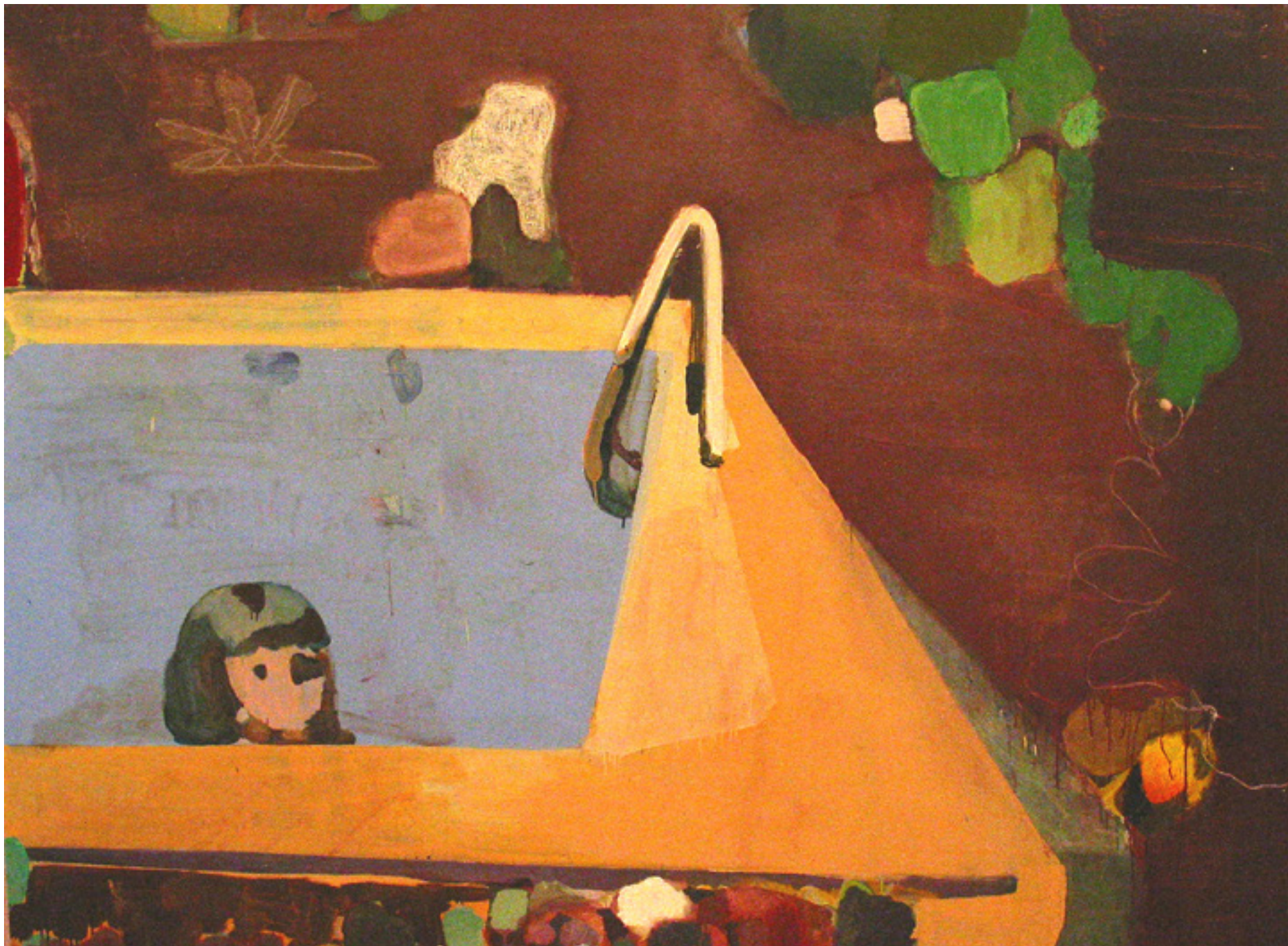
Teresópolis 2004-2005 -- técnica mista sobre tela/mixed media on canvas-- 140 x 180 cm