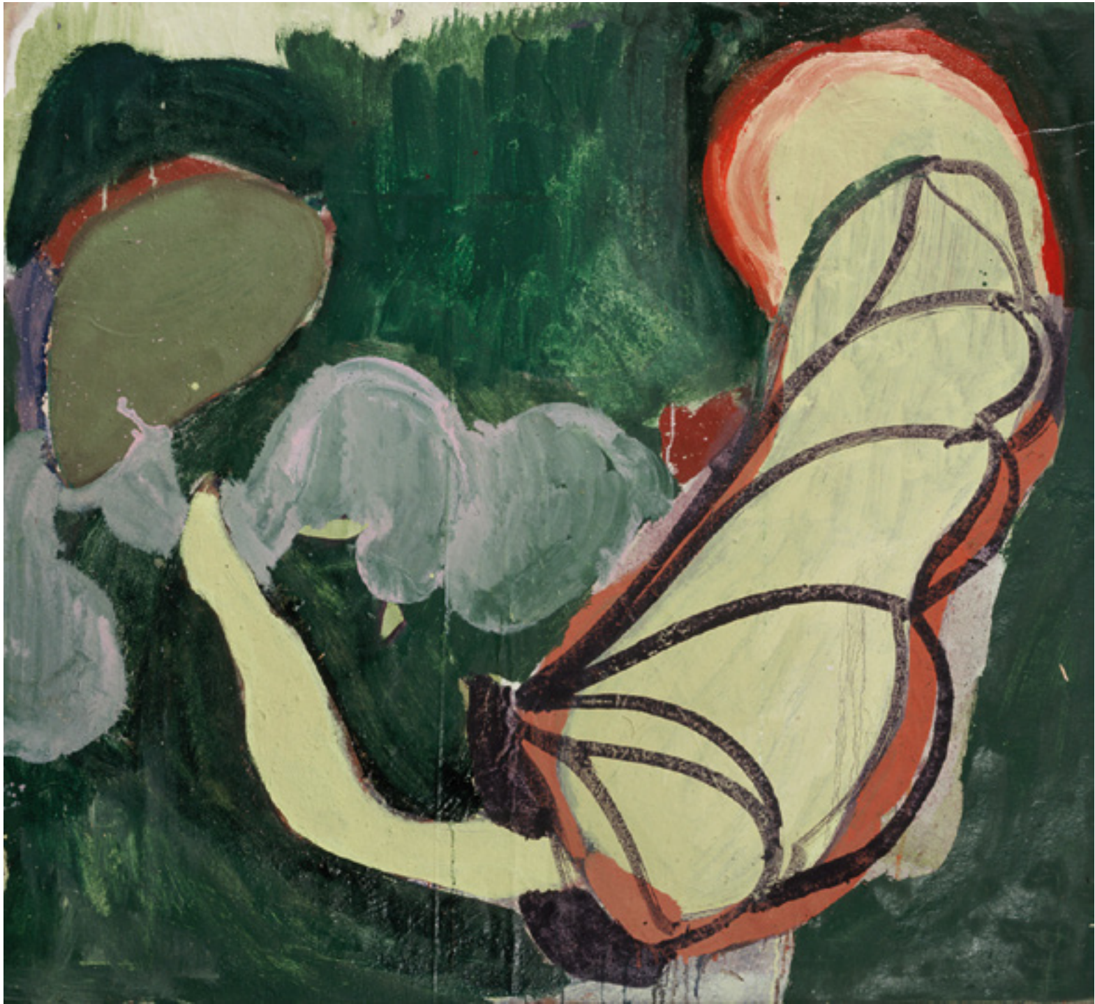
Embrião 1996 -- técnica mista sobre tela/mixed media on canvas -- 90 x 100 cm