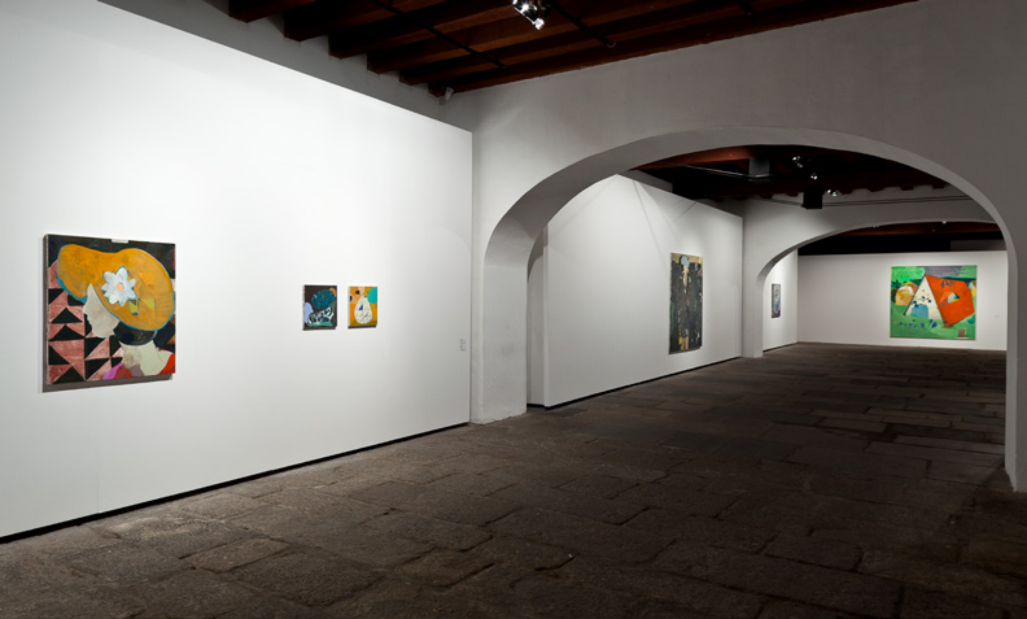
Entremundos 2014 -- Paço Imperial, Rio de Janeiro vista da exposição/exhibition view