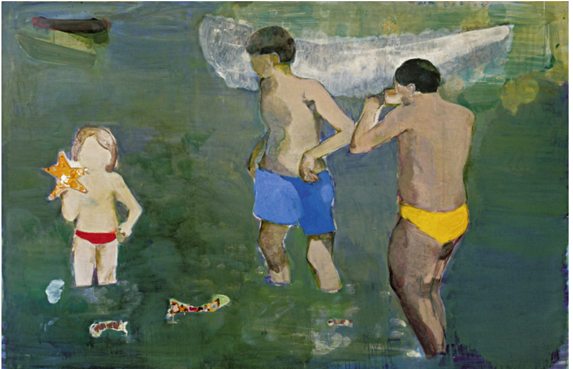
Família em férias 2007 -- técnica mista sobre tela/mixed media on canvas -- 170 x 260 cm