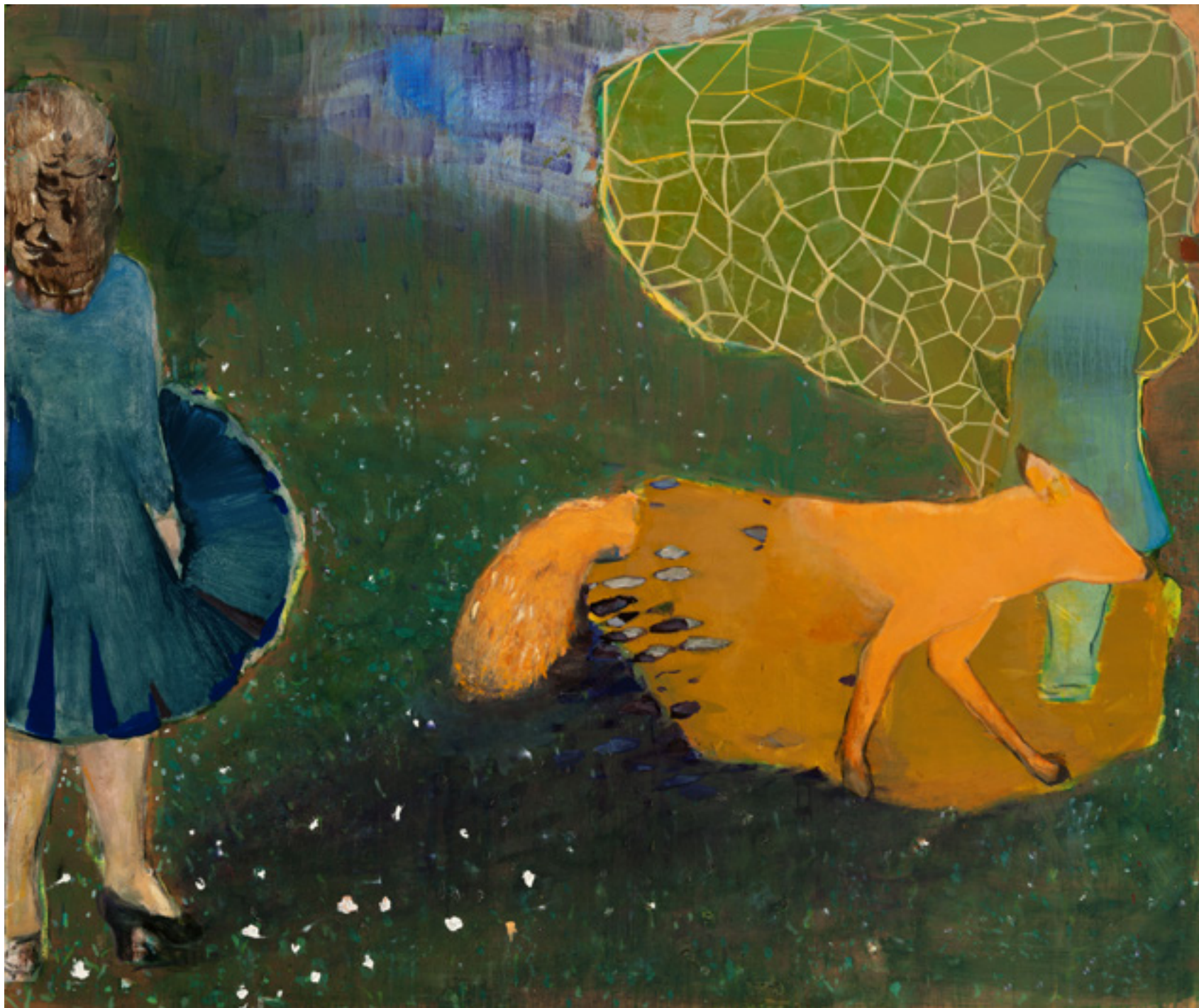
Good bye lógica 2012 -- técnica mista sobre tela/mixed media on canvas -- 155 x 170 cm