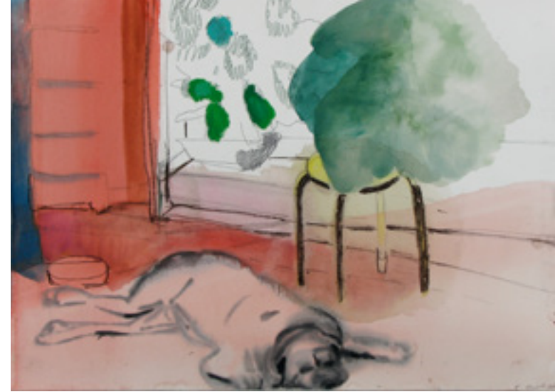
sem título/untitled 2008 técnica mista sobre papel/mixed media on paper 42 x 56 cm