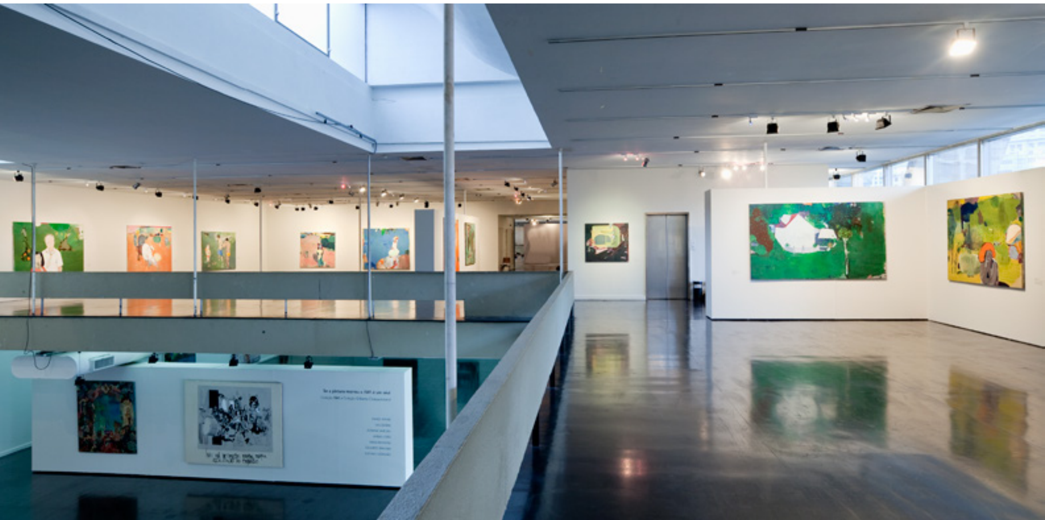
Arredores e Rastros 2010 -- MAM Rio de Janeiro vista da exposição/exhibition view